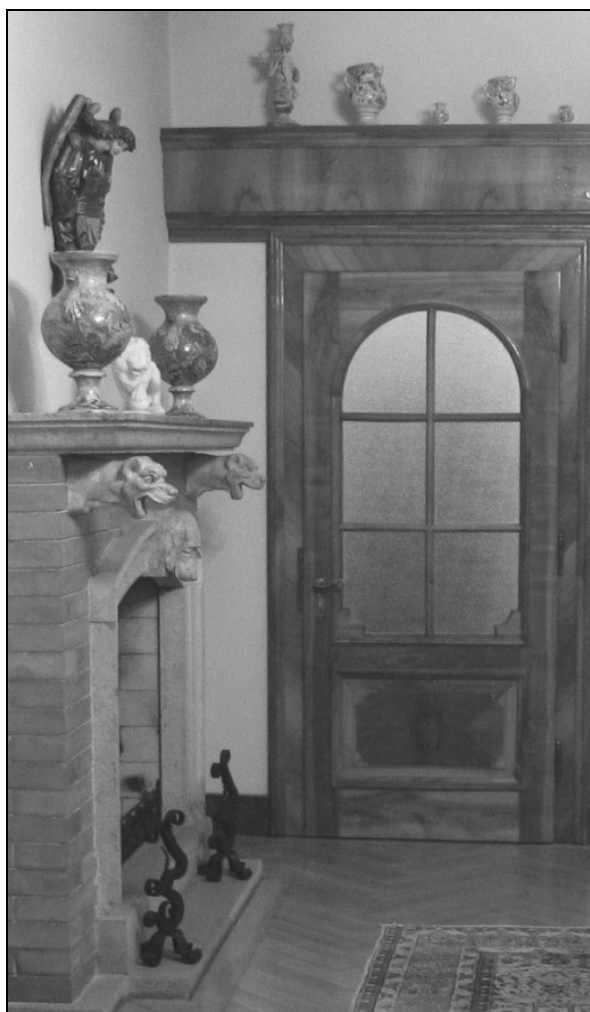
Pogled na sprejemnico s kaminskima žarama.

V istem prostoru stojita na kaminu dve monumentalni kaminski žari, najverjetneje iz začetka 17. stoletja. Kaminske žare so običajno v parih krasile vitrine, še pogosteje pa prav polico nad kaminom, ki je bila običajno namenjena razstavljanju posebej dragocenih ali kako drugače zanimivih predmetov, tudi spominkov. Obe imata masivni nogi in izrazito kroglasta trupa. Ročaja v obliki glav (morskih) pošasti – zmajev sta aplicirana na trup. Zanimiva sta prizora: na trupu prve je upodobljena bitka na kopnem (na nogi jo spremlja veduta gradu z visokim stolpom), na drugi pa je pomorska bitka, na nogi pa se ponovi pogled na morje z jadrnico v ospredju. Površina posod je poslikana v celoti. Zdi se, kot da gre za v drug medij preneseno slikarsko platno.