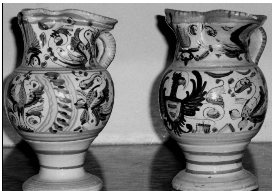
Majoliki, fajansa, severna Italija.