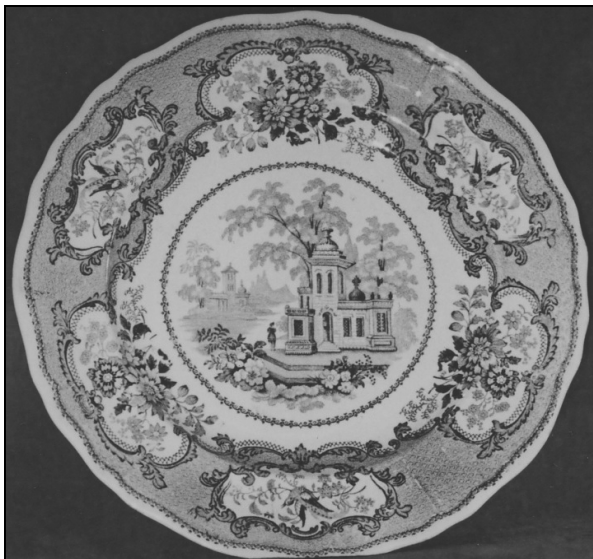
Krožnik, beloprstena keramika, Davenport, Velika Britanija.

Nekaj posameznih krožnikov prihaja še iz najznamenitejše angleške delavnice beloprstene keramike, iz tovarne Josiaha Wedgwooda. Wedgwood je bil tehnični inovator in utemeljitelj novih oblikovnih in motivnih zasnov. Pri izdelavi beloprstene keramike je uspešno združil umetnost in tehnologijo ter vzpostavil standarde za delo s to vrsto keramike, ki so se razširili po vsej Evropi.