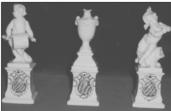
Putti muzikanti in plesalci, porcelan, Nymphenburg.

Enega najdragocenejših delov opreme na gradu predstavlja figuralna skupina Putti muzikanti in plesalci. Izdelana je bila v začetku 20. stoletja v tovarni porcelana Nymphenburg. Sestavlja jo osem puttov in dve okrasni žari. Figurine so izdelane iz bleščeče belega glaziranega porcelana, ulite so v kalup in bosirane. Stojijo na klasicističnih podstavkih. Ti imajo na sprednji strani bavarski grb (ta je istočasno tudi značka tovarne) z diagonalno od leve proti desni potekajočimi vrstami rombastih polj izmenjujoče se modre in bele barve. Grbi so obrobjeni s kartušami. Tovarna je bila od srede 18. stoletja naprej znana po svojih figuralnih kompozicijah, figurinah in namiznih okrasih. Tradicija izdelovanja kompletov figur na določeno temo (štirje letni časi, Commedia dell'arte, skupine Indijcev, Kitajcev, muzikanti, prizori iz tržnice ipd.) se je obdržala do danes. Tudi nymphenburške figuralne skupine so postale predmet zbiranja. Zaradi odlične izdelave in velikega povpraševanja so vedno dosegale visoke cene. Tako je še danes.