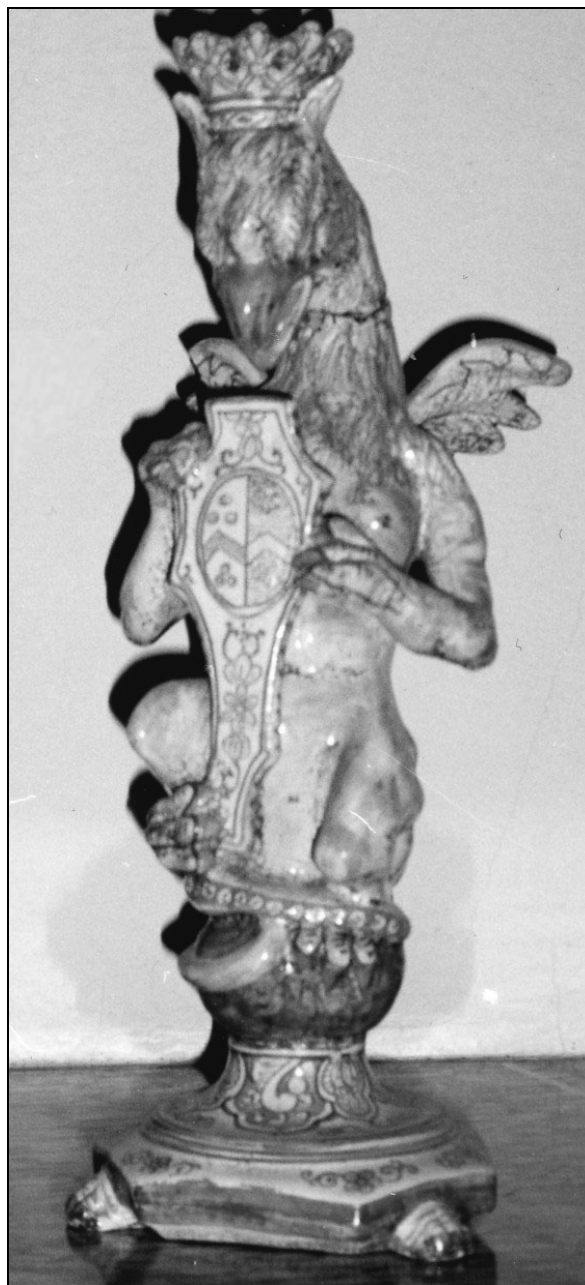
Grifon, fajansa, Severna Italija.

lico nad vrati. 9 Verjetno sta nastala v 18. stoletju v Severni Italiji. Oba sedita na kroglah, vstavljenih v podstavka, ki ju nosijo levje šape. Eden od obeh drži v sprednjih tacah konzolo s stiliziranim grbom v osrednji kartuši. Oba sta poslikana z značilnimi barvami, modro, rumeno in rjavo. Na glavi nosita kroni. Na spodnji strani podstavkov sta nalepki z napisom Tizian, ki dokazujeta, da sta bila kupljena v že omenjenem antikvariatu v Ljubljani.