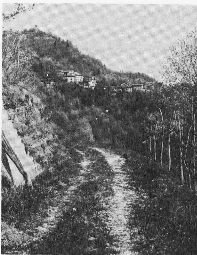
Debenje pod Sv. Štoblankom