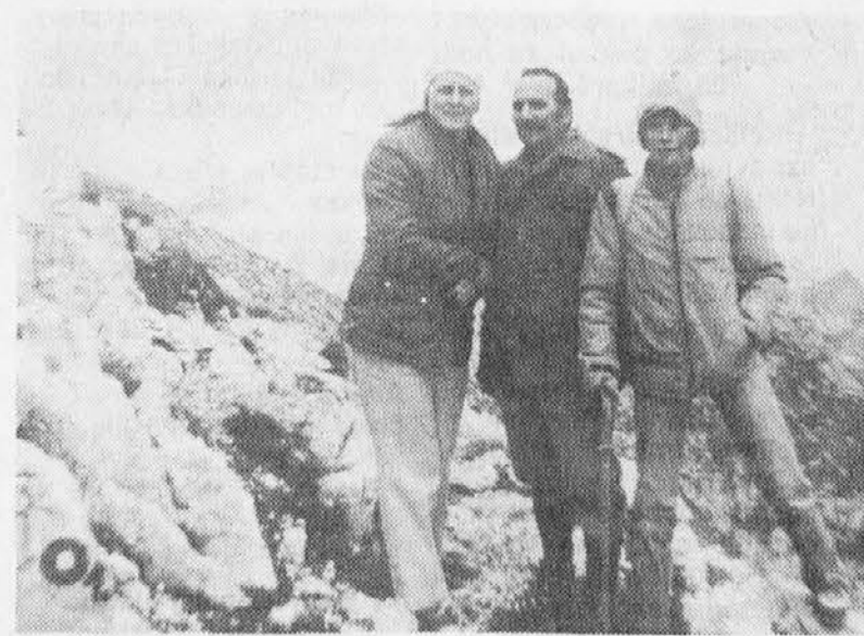
Brizova družina na vrhu Krna

Nekaj mesecev po njegovi smrti, ko smo urejali njegovo grobišče na pokopališču pri Devici Mariji na Krasu, se je njegov sorodnik povzpnel do vrha Krna in mu prinesel na grob košček kamna iz te krasne gore, rekoč: «Ko so te drugi gor vlekli, so ti branili priti na vrh avstrijske puške, a si vseeno prišel do cilja, ko si želel iti sam, da bi vžival v miru lepoto planinskega raja, ti tega niso dovoljili. Sedaj pa boš imel za večno na grobu košček tvojega ljubljene hriba».