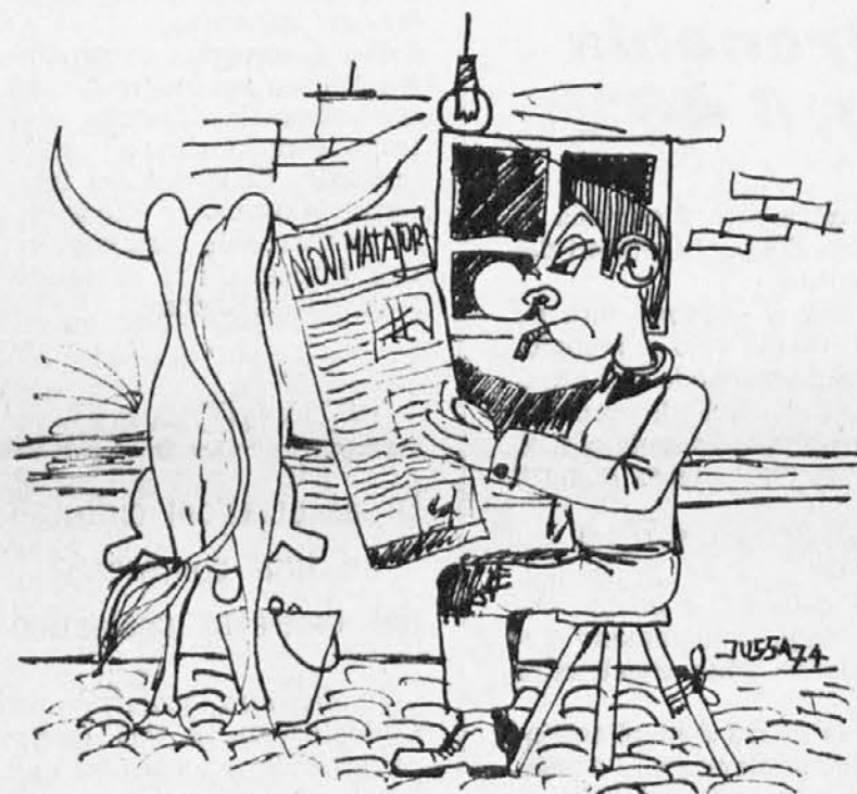
Tudi hlapec Tinac bere Novi Matajur