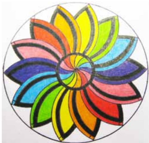
Avtor slike Jože M.

Pot je lahka, rahlo vzpenjajoča, polna lesenih mostičkov. Na koncu poti nas s svojim šumenjem že od daleč nase opozori slap, ki zgloda, kot bi bil ovit v zaveso. Slap Mostnice je osupljiv. Ob pogledu od spodaj navzgor na slap se mi prikaže mavrica, ki se blešči, ko se slapu dotaknejo sončni žarki in oblaki drobnih kapljic, ki jih povzročajo slap. Imam občutek, da se lahko s prsti dotaknem in ujamem mavrico že, če samo iztegnem roko.