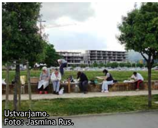
Ustvarjamo.