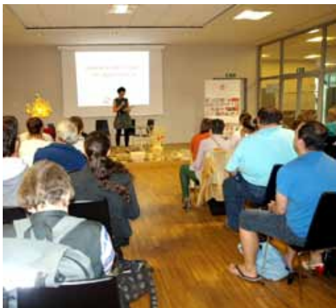
Predstavitve projekta.

V letu 2012 je bil ŠENT namreč ponovno uspešen pri prijavi na Javni razpis za izbor razvojnih projektov za dvig zaposljivosti ranljivih družbenih skupin na področju kulture in podporo njihovi socialni vključenosti v okviru Operativnega programa razvoja človeških virov za obdobje 2007-2013, ki ga sofinancira Evropski socialni sklad. S tem smo nadaljevali aktivnosti, začete v letu 2011, ko smo usposabljali težje zaposeljive, zlasti osebe s težavami v duševnem zdravju, za tkanje na statvah in izdelovanje izdelkov iz gline.