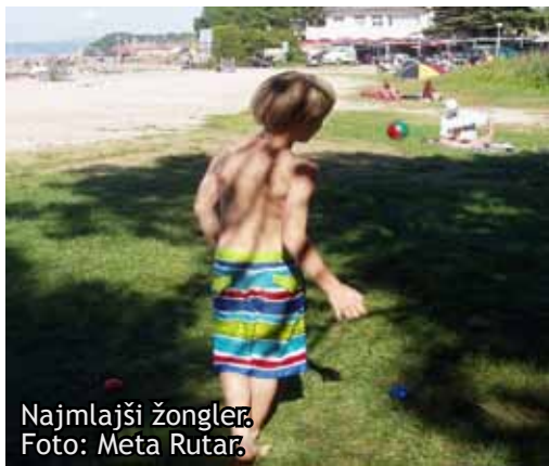
Najmlajši žongler.

Da ne bi zaostajali, so tudi na plaži postali pravi virtuozni v vrtenju cirkuških rekvizitov... O, kako je to zanimivo letelo naokrog, včasih v zrak, večkrat v travo. Vsak je našel svoje najboljše orodje in razvijal spretnosti.