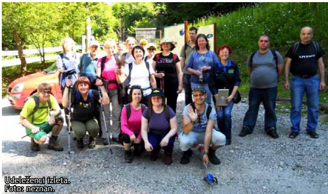
Udeleženci izleta.

V prijetno svežem in sončnem jutru smo se iz Radovljice z avtobusom odpravili po Gornjesavski dolini proti Kranjski Gori in pred Trbižem zapeljali na cesto za prelaz Predel. Med vožnjo smo opazovali pokrajino in se ozirali proti vrhovom gora Julijskih Alp. Počasi, da smo lahko kaj videli, smo se peljali mimo čudovitega Rabeljskega jezera v smeri prelaza Predel, mimo Trdnjave Predel in spominskega obeležja padlim branilcem Predela - Soškega leva iz I. svetovne vojne. Spustili smo se proti Trdnjavi Kluže, ki se nahaja v neposredni bližini ob cesti Log pod Mangartom in v bližini Bovca.