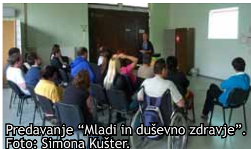
Predavanje "Mladi in duševno zdravje".