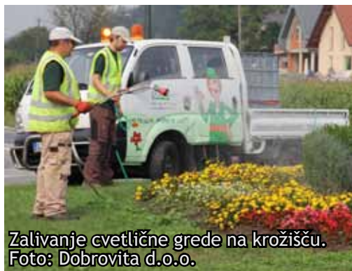
Zalivanje cvetlične grede na krožišču.

Dobro je, da vrtnar premore veliko znanja in izkušenj že pri setvi trave, saj je uspeh odvisen od številnih dejavnikov. Med pomembnejšimi so: izbira obdobja setve, količina in izbira ustreznega semena ter priprava zemljišča.