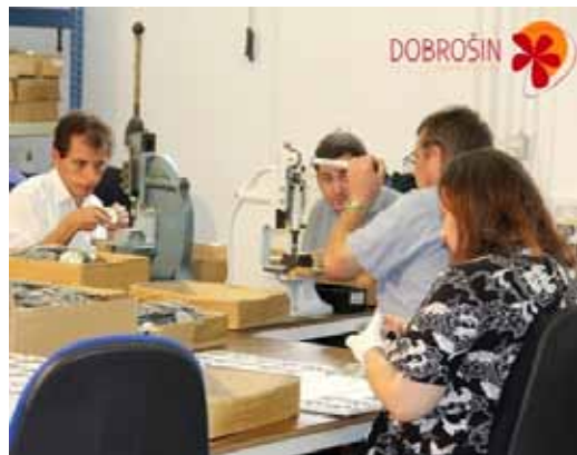
Delo v delavnici.