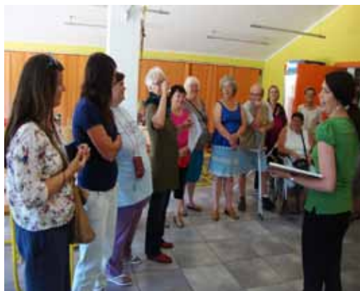
Pa smo ji dali njeno sliko.