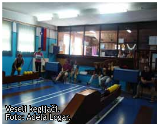
Veseli kegljači.