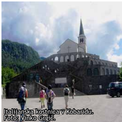
Italijanska kostnica v Kobaridu.

Ko smo prispeli v Kobarid, smo se najprej ustavili v Kobariškem muzeju, ki nam ga je razkazal lokalni vodič in si ogledali še kratek filmček »grozot« iz I. svetovne vojne. Z vodičem smo se povzpeli še do Italijanske kostnice okoli cerkve sv. Antona. Tu počiva 7.014 italijanskih vojakov. Letos obeležujemo 100-to obletnico začetka prve svetovne vojne. Potem pa smo se z avtobusom zapeljali po cesti Drežnica-Kobarid in preko Napoleonovega mostu do parkirišča, našega izhodišča za Slap Kozjek in začeli s pohodom proti najlepšemu delu pohodniške poti, kot so se izrazili naši člani, to je slapu Kozjak. Nekaj časa smo hodili ob bistri smaragdno zeleni Soči in ob zadnjem delu poti preko lesenih mostičkov in po malo spolzki poti ob jeklenici prišli do točke, od koder smo občudovali vse lepote, ki jih premore Slap Kozjak, ki priteče iz Krničice. Pohod po prijetni senci do slapu je trajal uro in pol.