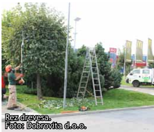
Rez drevesa.

nekaj let) 'obglavimo', mu močno skrajšamo veje, misleč, da bodo kmalu spet pogonale in zrasle.