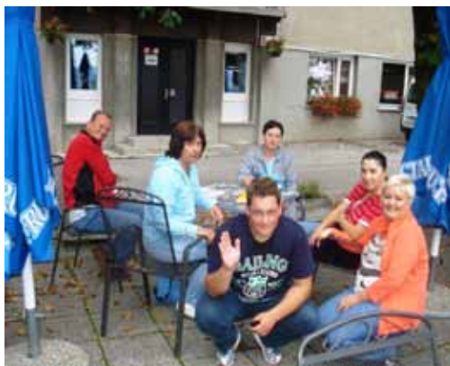
Na vrhu.

Ko smo prišli do vrha, smo vročino ohladili in kavico popili. Malo smo se pogovorili in proti dnevnemu centru nazaj krenili. To je bil dober dan, ki bi si ga želel vsak Trboveljčan.