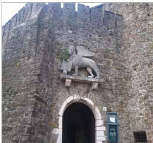
Vhod v starogoriški grad.