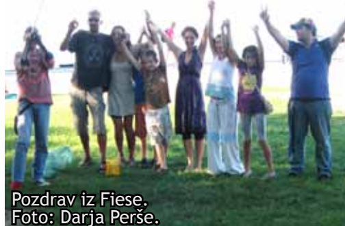
Pozdrav iz Fiese.

ŠENT-ovci iz DC za uporabnike prepovedanih drog Nova Gorica