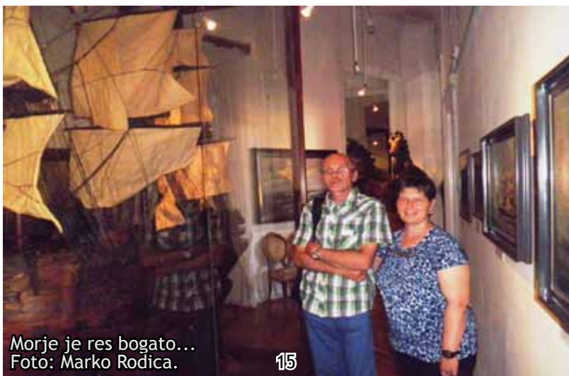
Morje je res bogato...