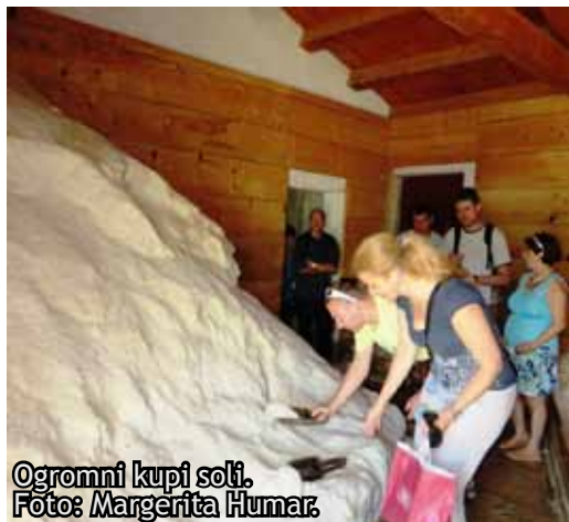
Ogromni kupi soli.

Na prvi avgustovski dan smo ŠENT-ovci iz DC Nova Gorica pričarali sonce in se odpravili ponovno na slovensko obalo, tokrat v Sečoveljske soline.