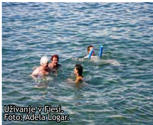
Uživanje v Fiesi.

V petek 25.7.2014, smo šli na kopalni izlet v Fieso. Bilo mi je zelo lepo.