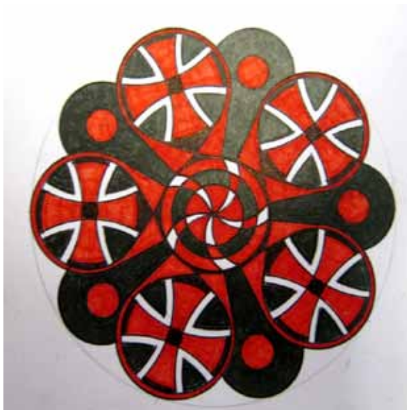
Avtor slike: Jože M.