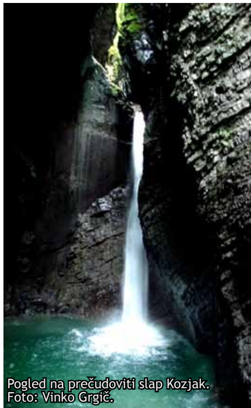
Pogled na prečudoviti slap Kozjak.

izletniški točki Mala Korita pri vasi Soča. Po slabi uri vožnje smo prispeli do Gostilne Metoja, od koder smo videli Kriške pode in gorovje Julijskih Alp, ki obkrožajo Trento. Kosilo je bilo odlično, saj smo jedli zelo okusne pice.