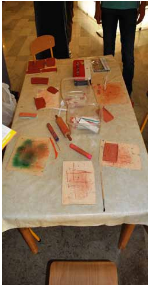
Izdelane tegole - strešniki z napisi. Foto: Brigita Jenko.