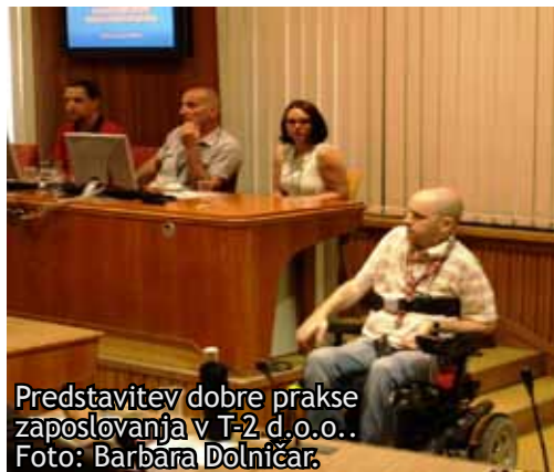
Predstavitev dobre prakse zaposlovanja v T-2 d.o.o.