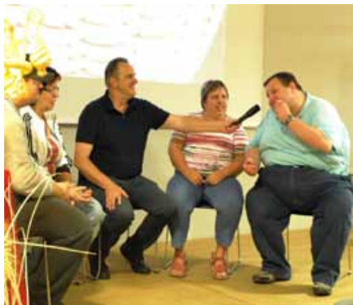
Udeleženci delijo vtise.

Projekt se izvaja v okviru Operativnega programa razvoja človeških virov za obdobje 2007-2013 4. Razvojne prioritete: »Enakost možnosti in spodbujanje socialne vključenosti« in Prednostne usmeritve 4.3.: »Dvig zaposljivosti ranljivih družbenih skupin na področju kulture in podpora njihovi socialni vključenosti v letih 2013-2014«