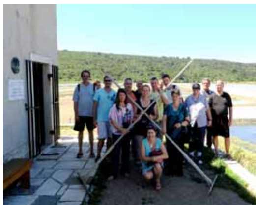
Med solinarji.