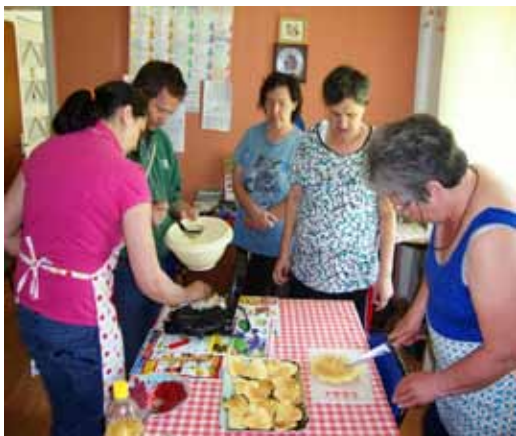
Mmm je dobro.

Dela se lotimo tako, da se dogovorimo katero pecivo bomo pekli in katere sestavine bomo potrebovali. Peka peciva se začne z določenimi zadolžitvami - nalogami. Pripravimo sestavine, recept in začnemo. Naši peki so zelo marljivi, natančni, in naredijo vse kakor piše v receptu. Na tak način učimo večšin za samostojno življenje: da bodo to znanje prenesli v svojo kuhinjo.