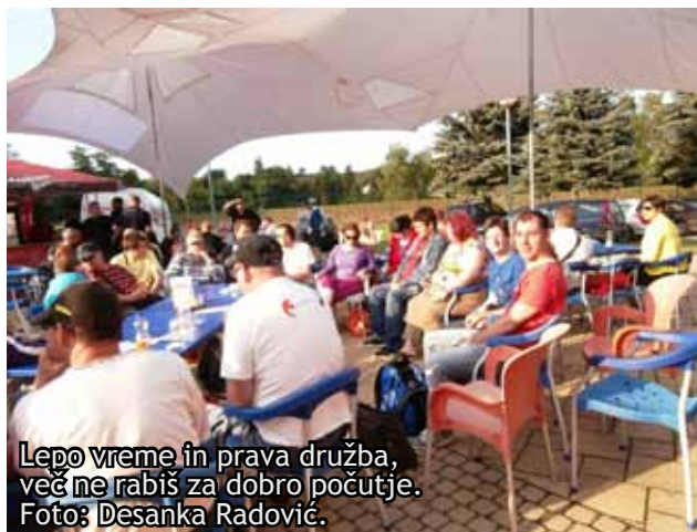
Lepo vreme in prava družba, več ne rabiš za dobro počutje.

Bližala se je ura kosila, zato smo se okrepčali v bazenskih restavracijah in barih. Hrana je bila zelo dobra, pa tudi mi smo bili zaradi številnih vodnih aktivnosti zelo lačni. Po obilnem kosilu je del naše skupine počival na ležalnikih, ostali pa so nadaljevali s kopanjem.