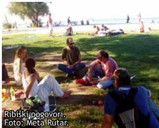
Ribiški pogovori.

Tisti bolj izkušeni pomorščaki, ki smo že veterani na obali, smo staknili glave in pokazali smer: "Tja proti Fiesi in Piranu odjadrajmo!" Tam nas je najprej sprejel lep oljčni nasad na hribčku, kjer smo se delno razpakirali. Od tam so ta veliki "otroci" vzeli pot pod noge, ta mali otroci in naš član z nogo v mačvcu, pa so se odpeljali direkt do plaže.