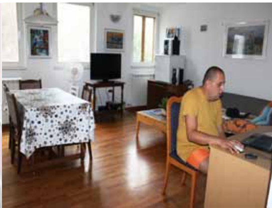
Stanovanjska skupina Koper.