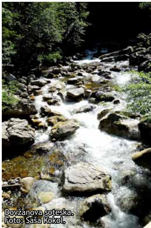
Dovžanova soteska.