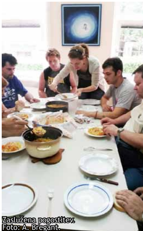
Zaslужena pogostitev.