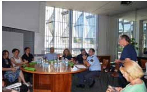
Okrogla miza "Vloga lokalne skupnosti pri nizkopražni obravnavi zasvojenosti".

spodbuditi k bolj kakovostni ponudbi različnih oblik pomoči osebam, ki so se znašle v težavah zaradi uživanja nedovoljenih drog in k bolj učinkovitemu povezovanju ustanov in strokovnjakov na lokalnem nivoju, kar je nujen pogoj za uspešno delo na področju zmanjševanja škode. Glavni poudarek govorcev na okrogli mizi je bil, da je sodelovanje med institucijami nujno in da lahko le skupaj uspešneje rešujemo obravnavano problematiko.