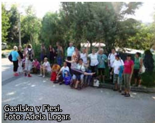
Gasilska v Fiesi.