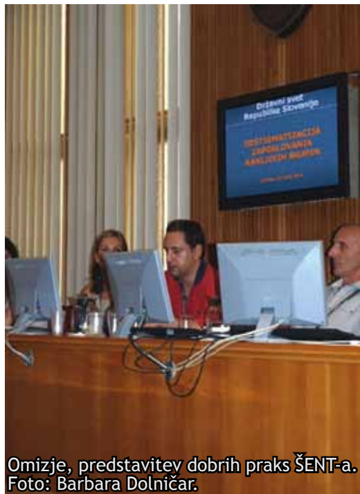
Omizje, predstavitev dobrih praks ŠENT-a.

Predstavniki SKUHNE so poudarili, da iščejo načine, da se čim prej »osamosvojijo« in preživijo na trgu, brez denarja ministrstva. V tem projektu vidijo veliko priložnost za zaposlovanje migrantov, izmenjavo kulture, hrane in svojih izkušenj.