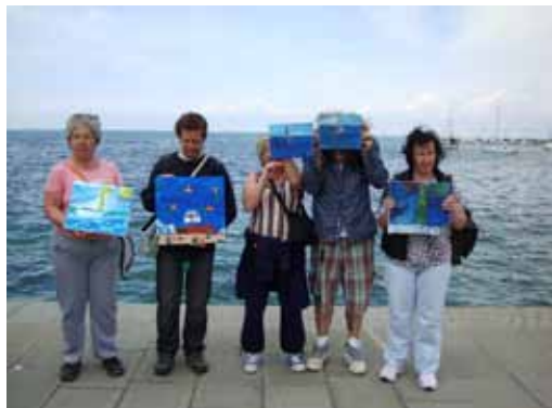
Utrinki iz Extempora.