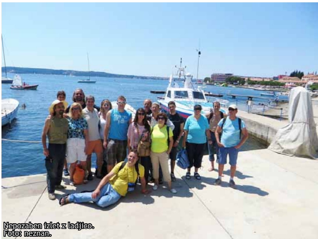
Nepozaben izlet z ladjico.