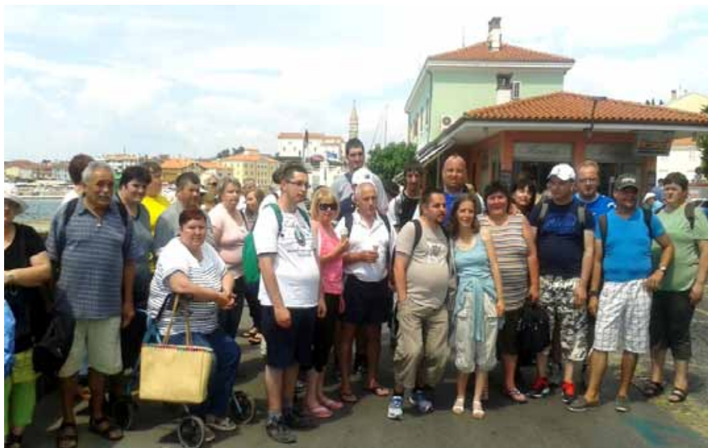
Člani ŠENT CELEIA Celje v Piranu.