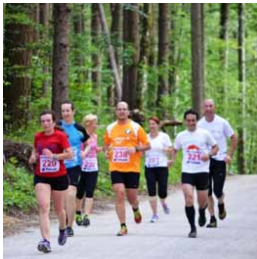
In smo tekli za ŠENT.