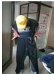
Podarjena oblačila s strani Zadruga Dobrote.

V Enoti Šent Velenje že nekaj časa sodelujemo z Zadrugo Dobrote z.b.o., nosilko projekta TEKSTILNICA, kjer skupaj z društvom Ekologi brez meja ustvarjajo zelena delovna mesta za težje zaposljive osebe na področju zbiranja in predelave rabljenega tekstila.