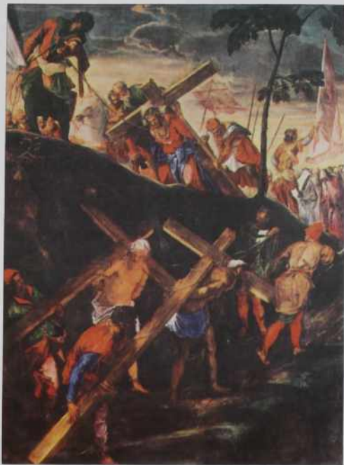
Tintoretto: Goridejnje na Kalvarijo

veliki petek, šteri svojo grejšno naturo na »križ razpeti« ino jo pokopa.