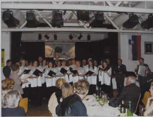
S prireditvijo so počastili slovenski kulturni praznik in tudi dan žena.

gda smo prišli gor 182 metrov visiko. Od tam smo leko vidli cejli varaš, ešče tovarno BMW tö. Pripelali smo se nazaj v center, se sprehajali. Več uni-