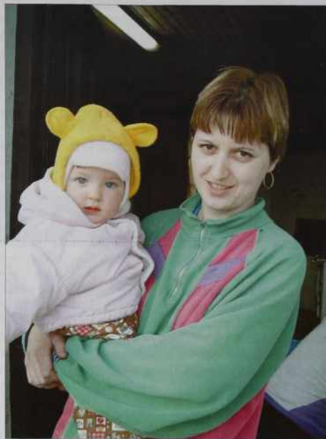
Anamarija pa hčerkica

»Bola tū kauli po vasaj, če je kakšna veselica. Pri nas je disko samo v Soboti. Tau je pa trideset kilomejtrov od nas. Mladina bola v krčmau odi. Nika malo spijejo pa se malo pogovarjajo, važno je tau, ka se leko srečajo. Prvin gda še malo autonov bilau v vesi, te smo se z dvōma pa z trejmi pelali na veselico.