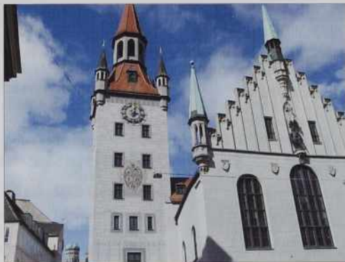
Cerkev sv. Duha, v steri je bila slovenska meša.

je München pisalo, te smo se že veselili. V tretjoj vöri popodneva smo prišli do cilja,