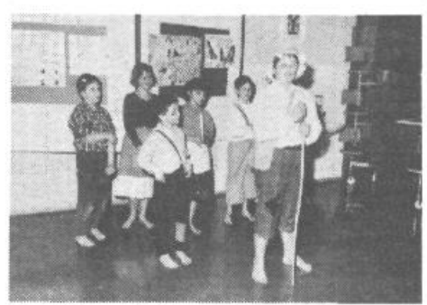
Z recitala pastirskih pesmi in običajev v OŠ Horjul