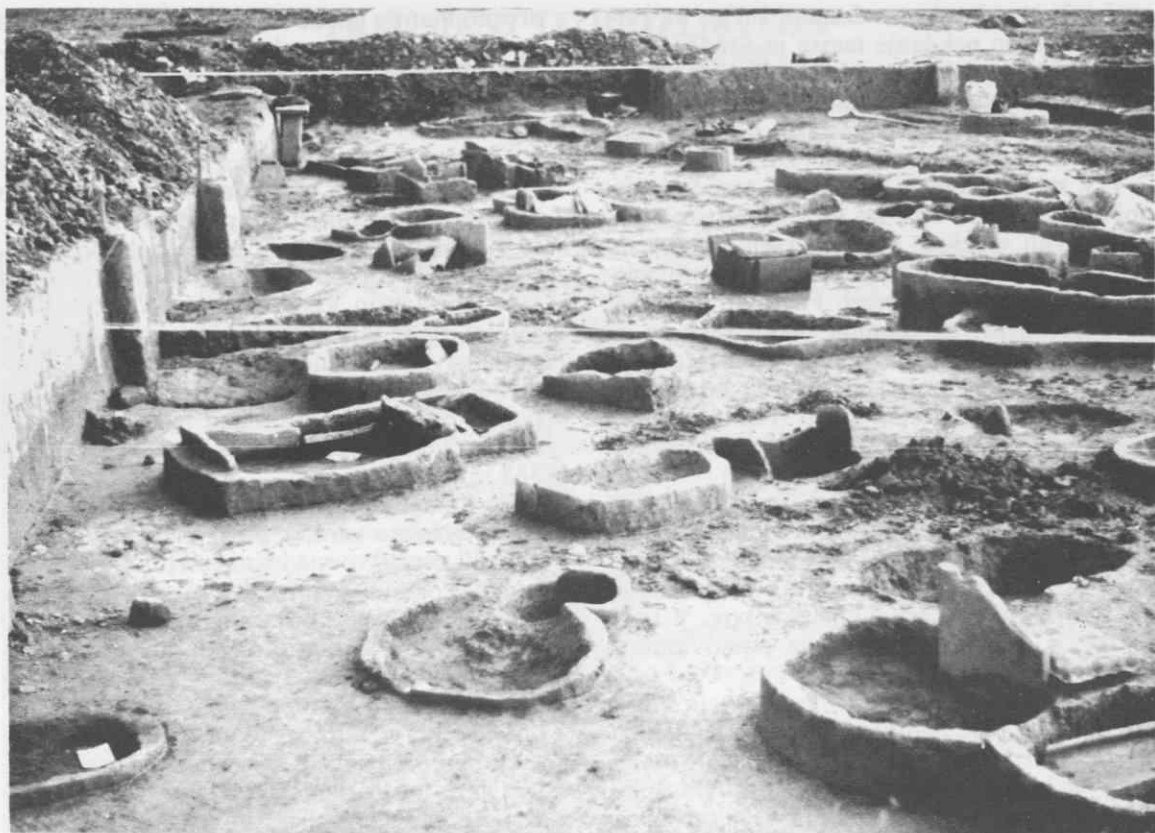
Pogled na izkopavanja na delu kasnoantičnega grobišča ob severovzhodnem predelu Poetovione (Rabelčja vas). Izkopavanja in foto Ivan Tušek

st.), v katerih so predvsem posvetila carinskih uradnikov, so bili postavljeni na robu mesta : I., II. mitrej na zahodnem, III. mitrej na severovzhodnem koncu. Šele vojaški V. mitrej, dobi uglednejše mesto v reprezentančni četrti v zahodnem delu mesta (Zgornji Breg), najmlajši, IV. mitrej iz Dioklecijanovega časa, ko so imeli mitraisti močno podporo cesarja, pa je bil lociran na robu poetovionskega foruma.