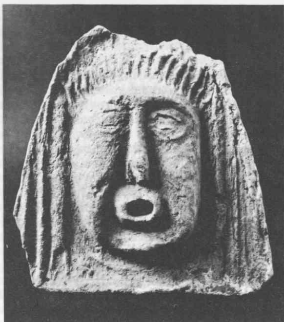
Čelak (antefix) s podobo maske je krasil vrh slemen poetovinske hiše.

Za gradnjo stavb so uporabljali najmanj tri vrste kamenja. Običajne stavbe so zidane ponavadi kar iz rečnih oblic, v tehniki »ribje kosti«, pri kateri so linije kamenja postavljene poševno, izmenično enkrat v eno, drugič v