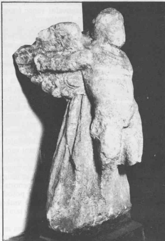
Marmorni kip Ikarja je bil verjetno nagrobnik prežgodaj umrlega mladeniča.

Druga obrt, nujno potrebna v mestu ob tako prometni cesti, je bilo kovaštvo. Kovačije so bile locirane predvsem ob robovih mesta. V vzhodnem delu je bil odkrit nagrobnik, ki v reliefu prikazuje orodje pokojnikovega poklica: klešče, kladivo in nakovalo. Tudi na zahodnem robu mesta, kjer so se ob carinski postaji ustavljali vozovi, je bila verjetno kovačija. Tu je stalo namreč manjše svetišče Vulkana in Venere s posvetilno ploščo, najden je bil tudi posvetilni kamen, posvečen Vulkanu (Volcano), najprej zaščitniku kovačev, kasneje