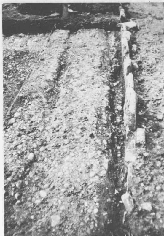
Odsek rimske ceste na vzhodnem robu Poetovione (prizidek porodnišnice). Posnetek prikazuje levi vozni pas s kolesnicama in na desni niz kamnitih plošč, ki so zaznamovale sredo cestišča. Izkopavanja in foto Ivan Tušek

kje zahodno od Črešnjevca), na severu na ozemlje Flavije Solve (Wagna pri Lipnici). Na Dravskem polju je ozemlje vključevalo Starše, Hoč pa ne več, potem je meja tekla po Slovenskih goricah in dalje, po Muri, na vzhodu je ager morda vključeval Varaždinske Toplice (posvetilni napisi Poetovioncev), na jugu pa je segal do vrha Haloz, ali še dlje, tako da je mejil na ager Andautonije (Ščitarjevo pri Zagrebu). Nadaljnje ugodnosti je mesto prejelo za časa cesarja Hadrijana, ugodnosti, ki so Poetovio dvignile nad običajno provincialno mesto. Takrat začne delovati na zahodnem obrobju mesta postaja carinske službe, ki je bila organizirana vse od meje z Recijo (današnja Švica), obsegala je Norik, nekdanjo provinco Ilirik, Mezijo in segala s pasom ob Donavi vse do obale Črnega morja (publicum portorium Illyrici). Carino je dal cesar za določeno vsoto v zakup, običajno so se s tem ukvarjali ljudje iz srednjih plemiških slojev (equites). Nekaj zakupnikov nam je znanih z napisnih marmornih kamnov tudi po imenih. Ker je šlo pri zakupu za večjo vsoto, jo je po navadi založilo več ljudi, v napisih se omenjajo običajni zakupniki tretjine carine. Za opravljanje carinske službe so lastniki nastavili izobrazne sužnje, večinoma iz grško govorečega vzhodnega dela države. Po tem sistemu je carina funkcionirala do leta 182, potem pa je prišla pod direktno cesarsko upravo in delovala še do konca vlade cesarja Septimija Severa leta 211.