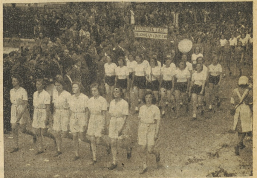
Naraščajnice v povorki

G. O. FZS, G. O. ZMS, G. O. ESZDNJ, G. O. AFŽ.