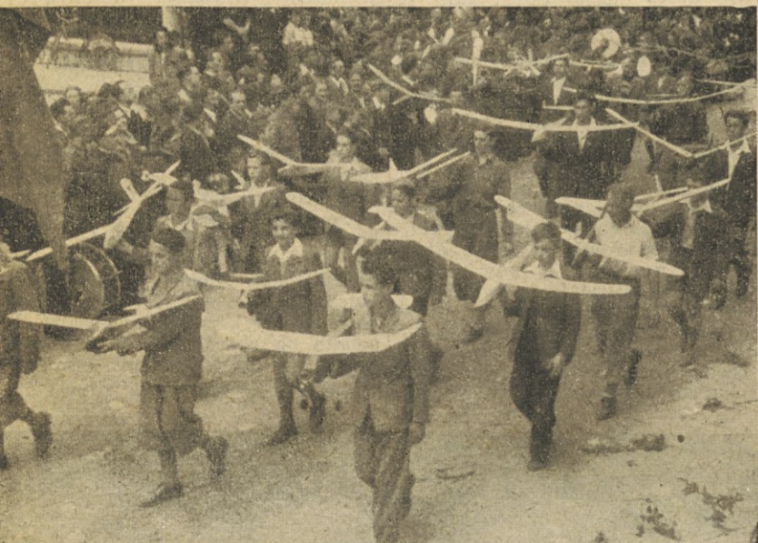
Člani Letalske organizacije Slovenije neso modele, ki so jih sami izdelali