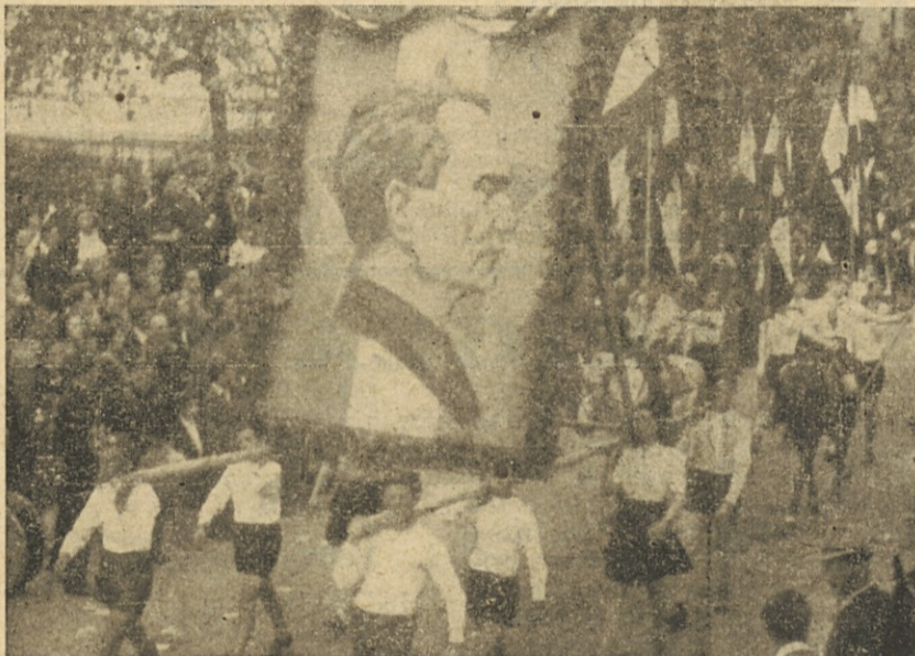
Fizkulturniki in fizkulturnice neso v paradi sliko maršala Tita

Pokazalo se je, da je želja za fizkulturnim izživljanjem prodrla precej široko med ljudske množice, posebno na vas, kjer kmetijska mladina z vso resnostjo sodeluje pri vseh prireditvah, kar je osnovni pogoj za ves nadaljnji razvoj v pogledu vsestranosti in množičnosti v fizkulturi.