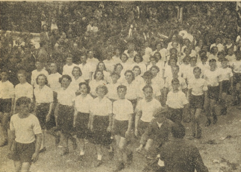
Oddelek pozdravlja častne goste na tribuni

bo za dvig delovne sposobnosti in za krepitev obrambne moči naroda s fizikulturo. Poleg tega bo vodil državne ustanove za fizikulturo občanarodnega značaja.