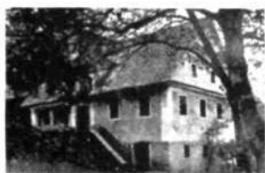
Martin Justin trgovina in gostilna

Gozda je v župniji še veliko. Največji ter največ vredni gozd je »Zala«, o kateri hočemo na posebnem mestu še kaj več povedati; obraščen je pa tudi Špik, Ga-