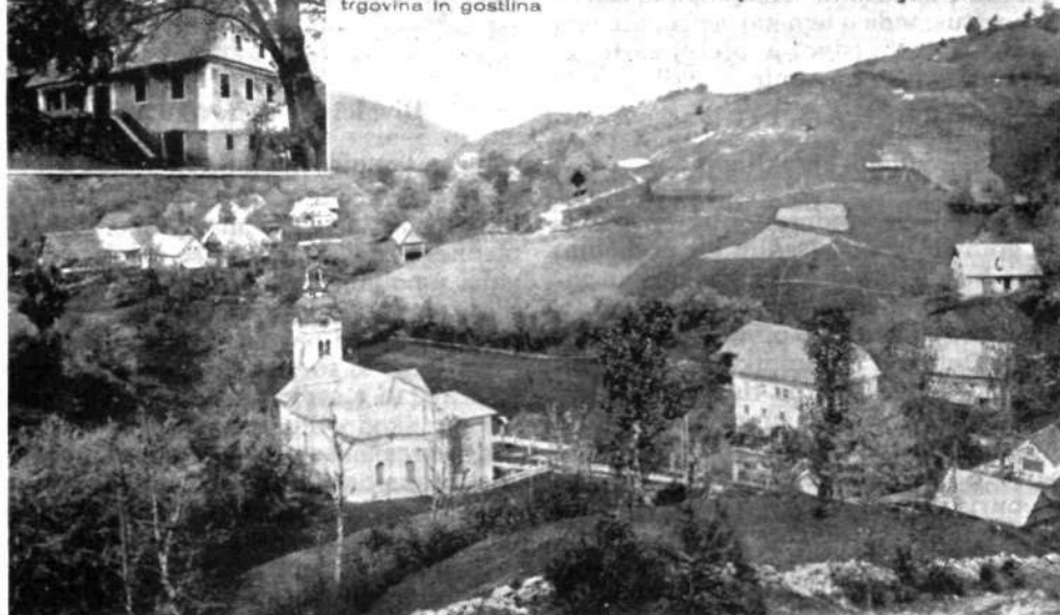
Panorama Lučin (razglednica iz časa pred 2. svetovno vojno)