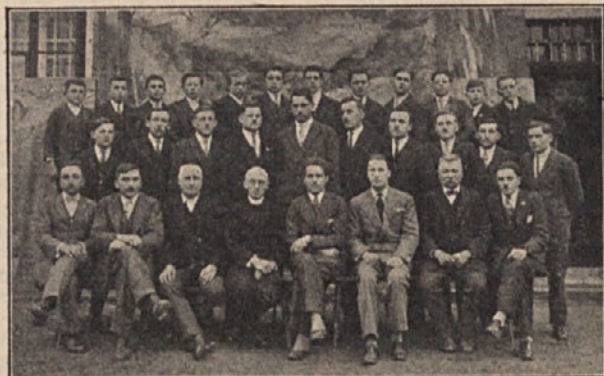
Gojenci kmet. nad. šole pri Sv. Andražu v Slov. gor.

Za sklad N. D. je daroval J. Jemec 100 Dinarjev; neimenovani 80 dinarjev. Živeli posnemovalci in posnemovalke! Pri prvi priliki se spomnite svojega glasila in darujte ter zbirajte za sklad N. D.