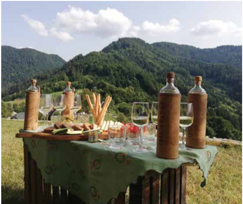
Slika 4: Degustacija izdelkov lokalnih kmetij na kolesarski poti.

Kolesarjenje v Sloveniji spada med pomembne športnorekreativne dejavnosti, saj je v vrhu med slovenskim prebivalstvom tako po priljubljenosti kot razširjenosti. Kljub temu pa se njegovega pomena kot turističnega produkta premalo zavedamo, kar je najpogosteje povezano s težavami pri dogovarjanju med lastniki zemljišč, lokalno skupnostjo in nenazadnje lokalno turistično organizacijo (Vidgaj 2019). Strategija razvoja turističnega proizvoda kolesarjenje v Sloveniji iz leta 2005 navaja številne prednosti razvoja kolesarskega turizma, na primer minimalni vpliv na obremenjevanje okolja, dvig trajnostne mobilnosti, priložnost za razvoj podeželja in drugih manj razvitih območij, spodbujanje investicij in drugo.