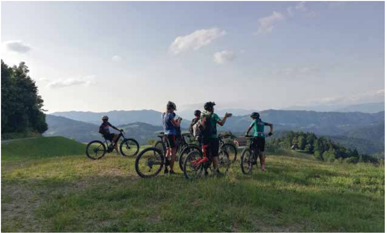
Slika 3: Kolesarska pot po Škofjeloškem hribovju vodi tudi do številnih razglednih točk.

področja ukrepanja. Eno izmed njih je tudi ustvarjanje (novih) delovnih mest, izpostavlja pa tudi, naj se na podlagi inovativnih pristopov razvije privlačne, tržno zanimive proizvode in storitve, da se ponudnike poveže in okrepi trženje. Ta ukrep se nanaša tudi na področje turizma.