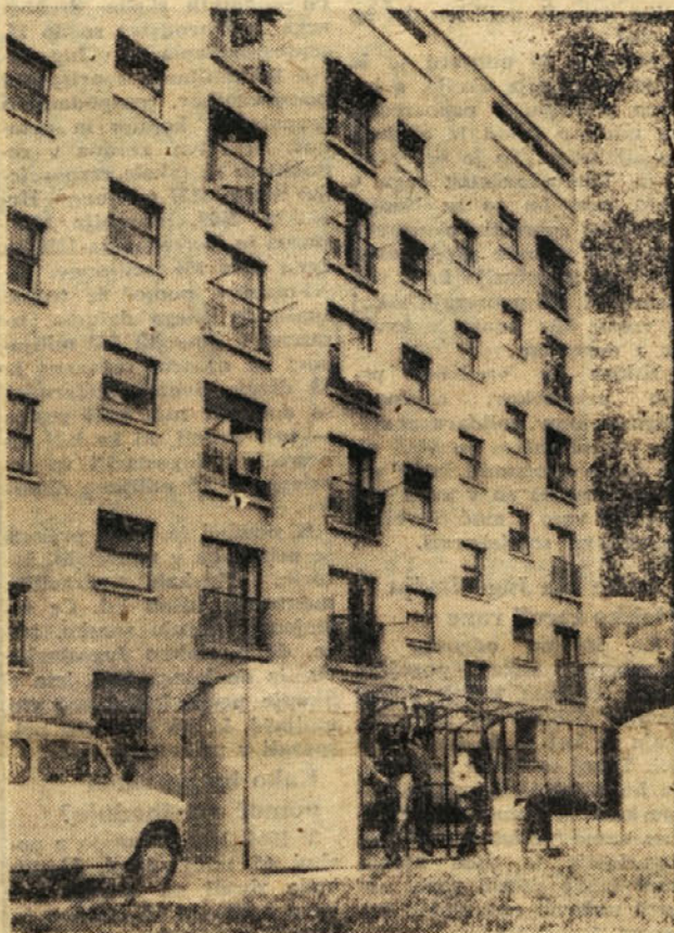
JESEN JE TU. To so začeli občutiti tudi lastniki motorizacije. Treba je urediti garaže. Na Kešetovem v Trbovljah so se tile odločili kar za montažno garažo