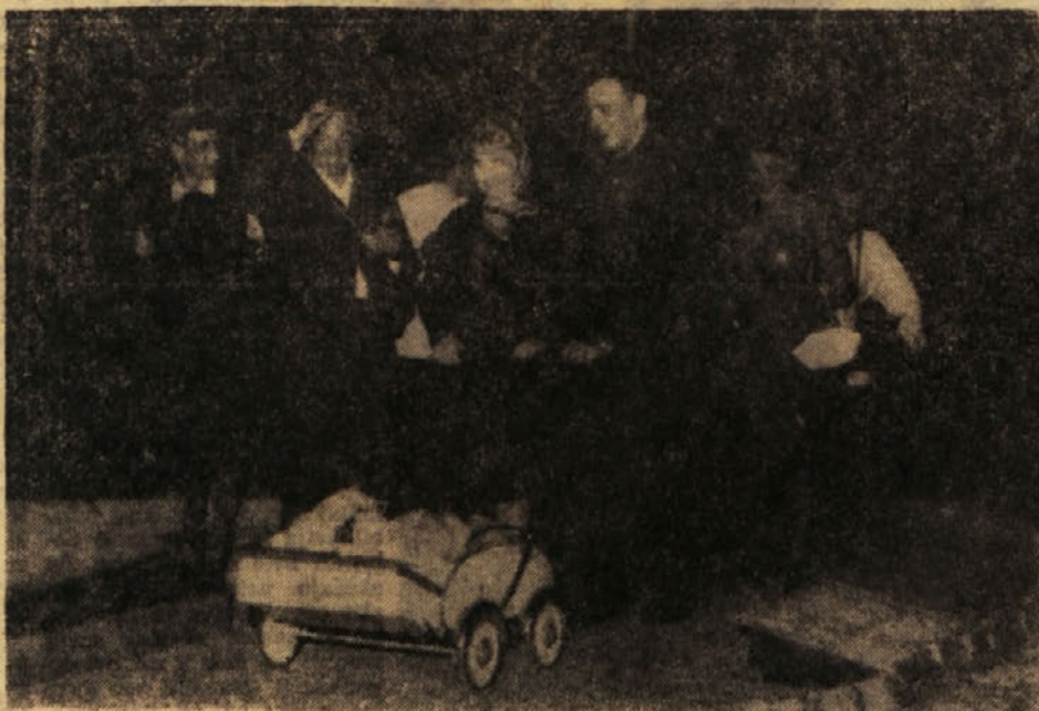
Z NASTOPA TRBOVELJČANOV NA HVARU (»Irkutska zgodba«)