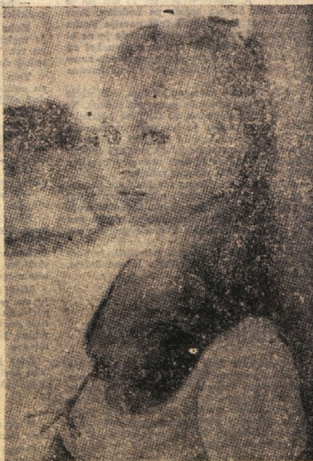
IZ ALBUMA FILMSKIH IGRALK: B. B. (Brigitte Bardot)

S poroko bosta morala počakati tako dolgo, dokler ne bo njegova prva žena, ki se je medtem poročila, pristala na ločitev.