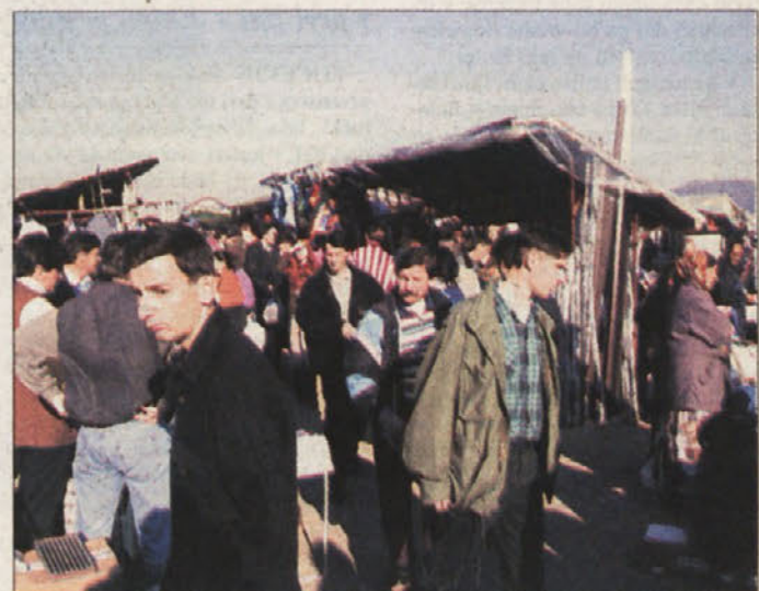
Na stojnicah je največ tekstilnih izdelkov, ki so poceni.