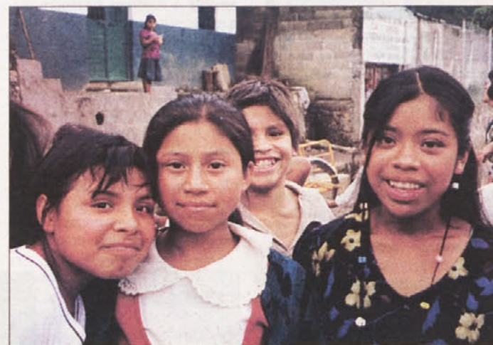
Otroci, ki obiskujejo šolo, pa se morajo že takoj v prvem razredu samodejno naučiti španskega jezika, v katerem govori učitelj.

Če delaš, kolikor hočeš, in dobiš, kolikor narediš,