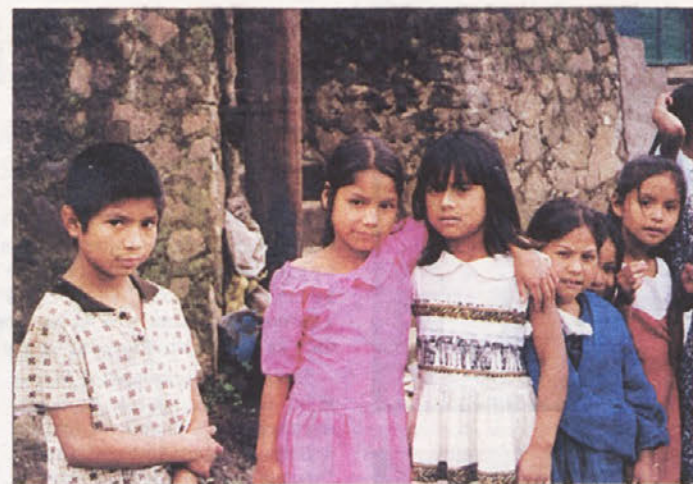
Splošna nepismenost po vaseh je posledica brezbržnega šolskega sistema. Starši večino svojih otrok najraje zadržijo doma.