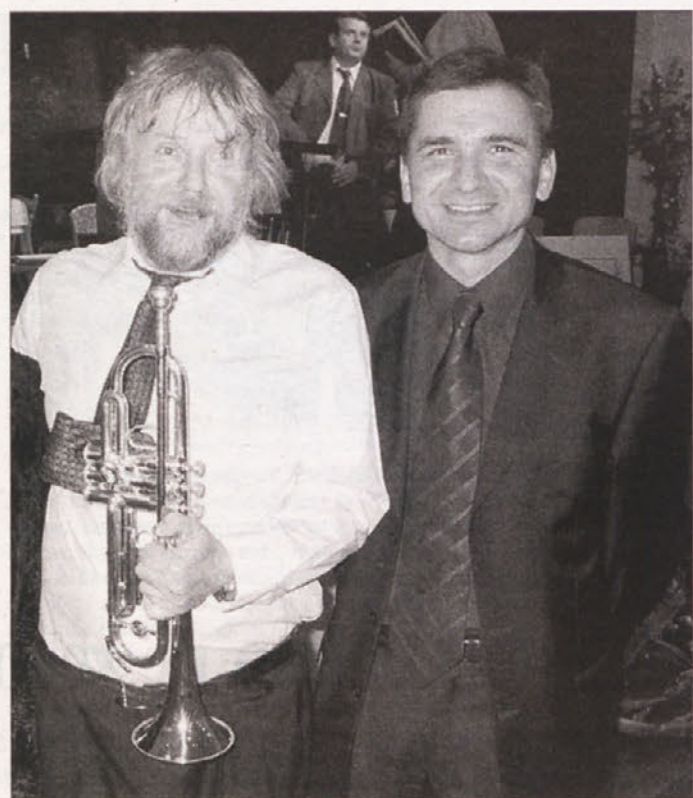
OBČINA BO POMAGALA PRI NAKUPU INŠTRUMENTOV - Tudi božično-novoletni koncert Pihalnega orkestra Kočevje je navdušil nabito polno dvorano Šekoveha doma.