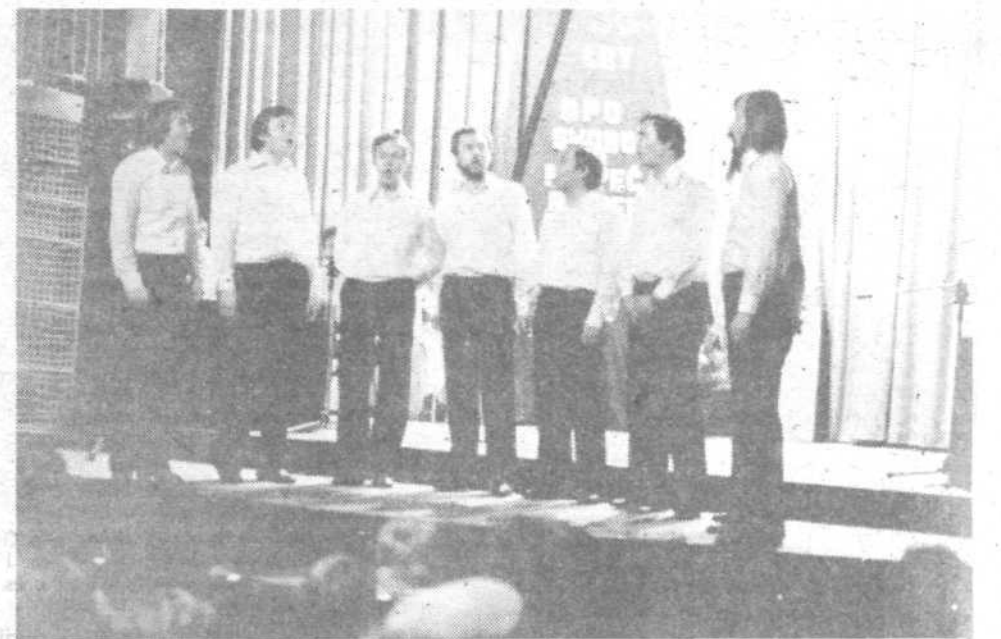
V soboto 11. decembra so v Podpeči praznovali 30. letnico uspešnega delovanja njihovega kulturnoumetniškega društva!

Najprej omenijo Turke, Stritarja, bič in kopito. Bojda je Velika Slevica, točneje nje-