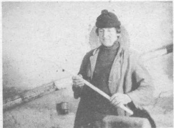
hlev in z rezilnikom in strgom oblikuje kuhavnice. Pravi, da je v hlevu toplo in da je prijetno delati med zajci in živino.