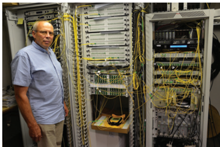
Marjan ob računalniški opremi

Zatem smo polagali koaksialne kable. Ti so neprimerno zmogljivejši od telefonske parice in omogočajo istočasni prenos več programov in interneta. Slaba stran kabelskega sistema je, da je na razvodu potrebna elektronska oprema. Že kar nekaj let pa se polagajo optični kabli. Prednost je v skorajda neomejeni hitrosti prenosa, optična vlakna niso občutljiva na motnje iz okolice in niso občutljiva za atmosferska prazenja, strele. Trenutna slaba stran je visoka cena izgradnje omrežja in visoka cena elektronske opreme v glavni postaji in pri strankah. Je pa to telekomunikacijska infrastruktura bodočnosti.