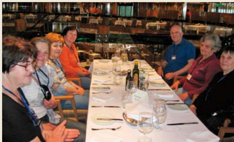
Bliža se eno leto od prelepega izleta v Benetke, zato je slika zgoraj namenjena majhnemu podoživetju razkošja teh luksuznih ladij.

Za 25. 4. 2015 smo imeli načrtovan »izlet« z IGA RELAXOM v Zreče. No, s tem ne bo nič, kajti ukinjajo se tudi njihove destinacije. Namesto v Terme Zreče jo bomo mahnili v Šmarješke Toplice. Mnogi so še bolj zadovoljni, saj je Šmarjeta nekako bolj domača. Za izlet v maju je še vse odprto. Tudi 3-urno kopanje v Žusterni je odpovedano, nove destinacije pa še usklajujemo. ■