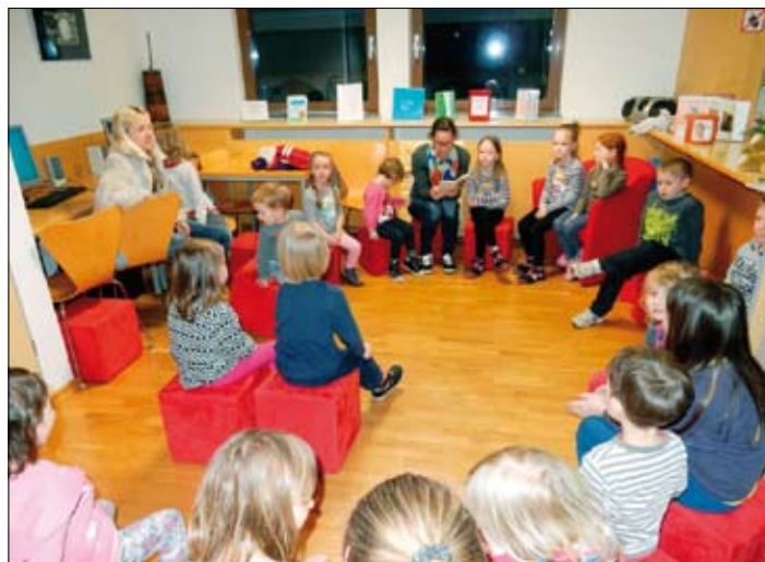
Pravljčne urice – vsak petek ob 18. uri

Mestna knjižnica Grosuplje, enota Dobropolje