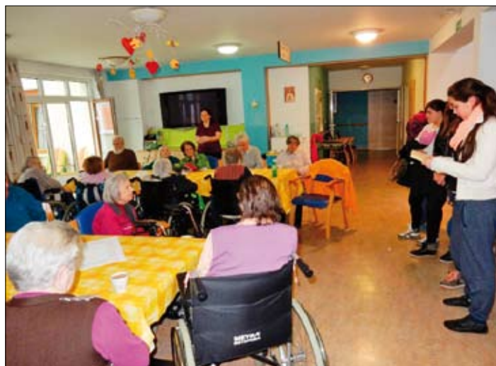
Odpri knjigo, odpri srce – branje starejšim v Zavodu sv. Terezije