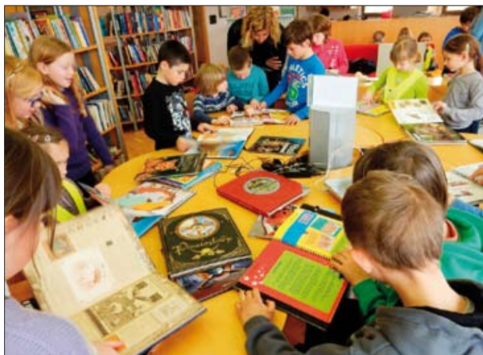
Učenci od 1. do 4. razreda PŠ Kompolje na obisku v knjižnici