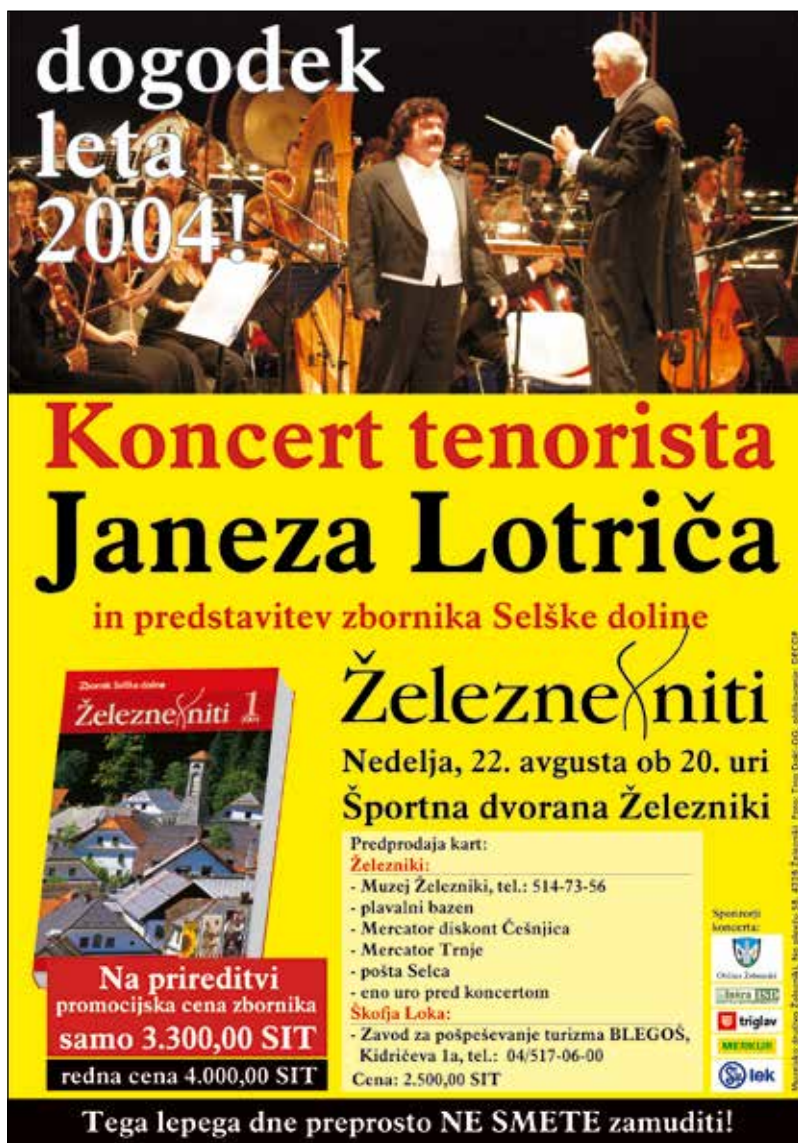
Plakat za koncert.