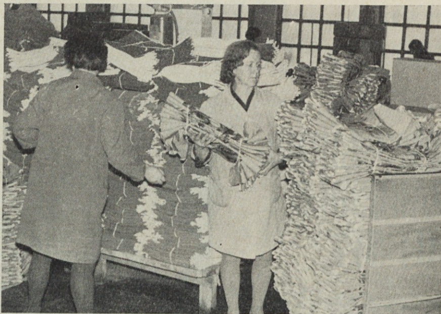
Prizor iz konfekcije — nakladanje pošiljke za izvoz. Del deviz za uvoz si moramo sami zagotoviti... Pri izvozu pa moramo prebiti vse zaščitne carine in uvozne davščine. Večji del izvoza je torej izguba...