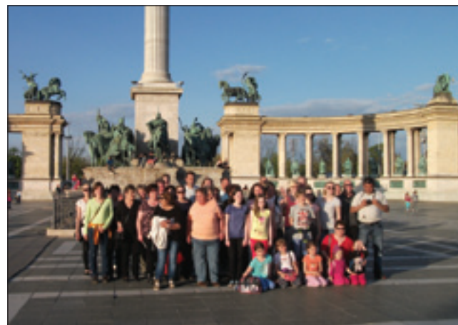
Na Trgu herojev

dosti časa meli, ka so v šestoj že zapirali. Dapa smo zatok vidli dosta živali, zanimive so bile ti- ste, stere ne vidimo vsaki den. Vreme je bilo lejpo, volau smo tō dobro meli, zatok smo se v veseljem sprehajali po žival- skom vrti. Malo že zmantrani,