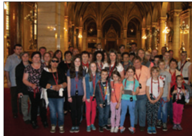
Naša skupina v parlamentu

V soboto, 16. apriliša, okoli pau sedme vōre se je autobus napu- no in je štarto z Dolenjoga Seni-ka. Bile smo vse generacije, od 5 do 70 lejt starosti. Bila je fajn skupina, med potjov smo se do- sta pogučevali, vej smo pa v meli dosta časa, dokač smo prišli do