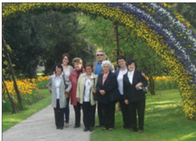
Porabska skupina je obiskala tudi park cvetja - Mozirski gaj

Ker je glavna tema prireditve bila ljubezen, na katero se je nanašal tudi podnaslov prireditve »Ljubezen je bila in bo, ko mene in tebe na