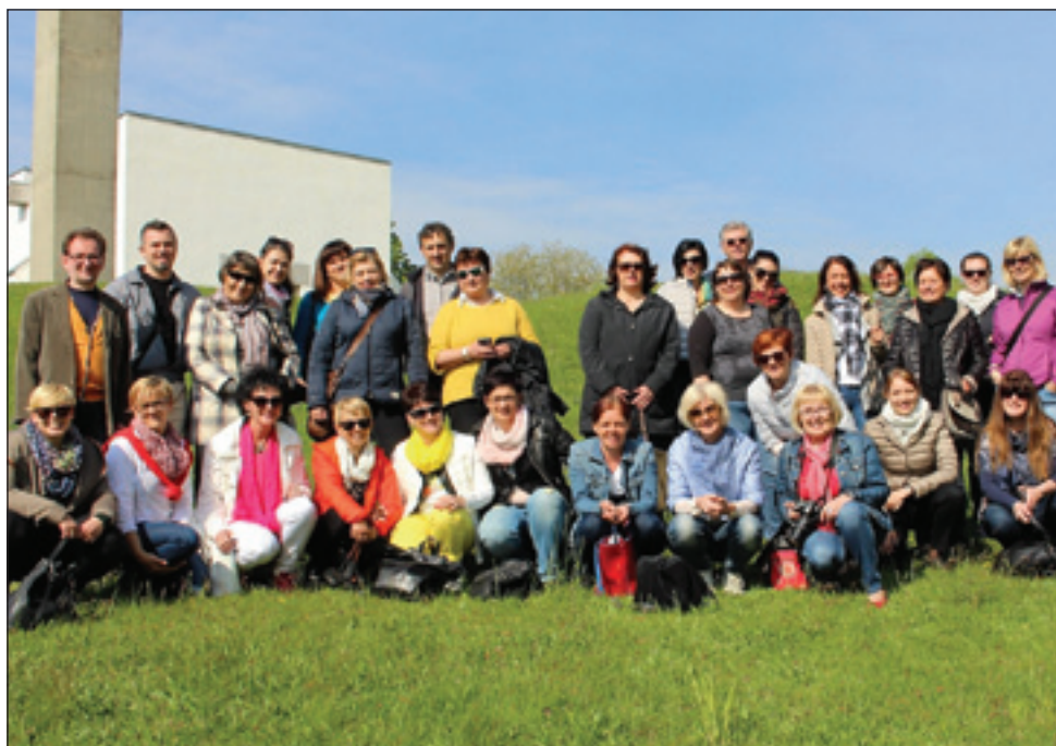
»Po sledih Slovencev«. Udeleženci na izletu v Modincih/Mogersdorfu pri križu v spomin na monoštrsko bitko