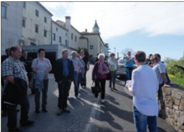
Porabska skupina med vodenim ogledom

dele: grad, trg in predel okrog cerkve. Na koncu ogleda so nas povabili v grajsko klet, ki so jo pred kratkim obnovili in jo uporabljajo za predstavitev domačih vin in druge prireditve. Ko smo prispeli v Šempas, so nas gostitelji povabili na turistično kmetijo, kjer smo poizkušali domače klobase, pršut in vino.