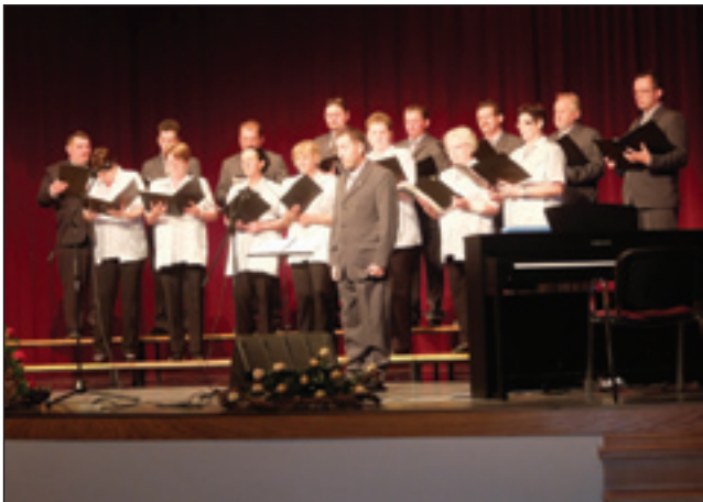
Mešani pevski zbor ZSM Avgust Pavel na šempaškem odru

je pa z njega prelep razgled na celo Vipavsko dolino in gore okrog nje. Vas, ki je tako kot druge v tej dolini, zgrajena iz kamna, ima tri pomembne