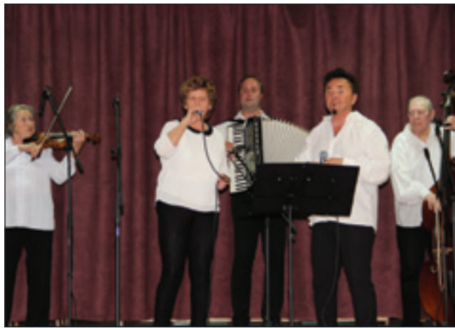
Člani skupine Gorički klantoš na odru sakalovskega kulturnega doma

ce samouprave, ki je na kratko predstavila skupino. Ko je ona predala oder nastopajočim, je