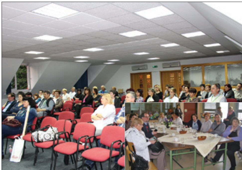
Na letošnji seminar je prišlo kakih 50 udeležencev. Pogovori na dobrovniški šoli (manjša slika)

Udeleženci seminarja so se prvi dan spoznavali med seboj, izmenjevali izkušnje, naslednji dan so obiskali dve dvojezični šoli v Prekmurju, kajti to je bila želja od lani. V Prosenjakovcih in v Dobrovniku so - po predstavitvi šol s strani ravnateljic - prisostvovali pouku, dvojezični učni