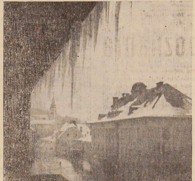
Zimski motiv iz G. Radgone

Tečaj bo v dveh izmenah, skupno pa se ga bo udeležilo okrog 60 traktoristov. Na koncu tečaja bo tudi izpraševanje in ocenjevanje. do