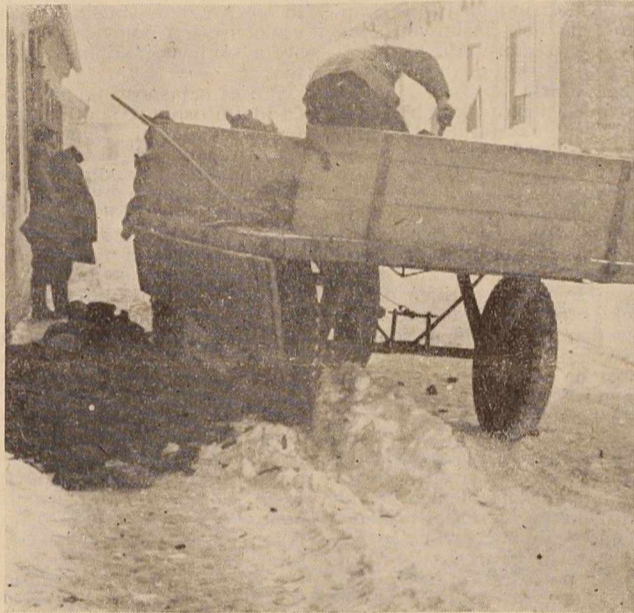
In še posebno zimsko veselje — kadar pripeljejo premog

ga naj ima v družbenem življenju kultura in še druga vprašanja so predmet živahnih razprav.