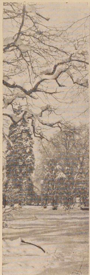
Zimska lepota — in mraz!

te, ki težje založijo svoje drvarnice z drvni kot na vaseh. Kljub mrazu, se še lahko grejemo, premog nam še ni zmanjkal. Zima pa nas je spet prepričala, da bo potrebno že v spomladanskih mesecih misliti nanjo, ker se ne ozira na pomanjkanje vagonov in premoga.