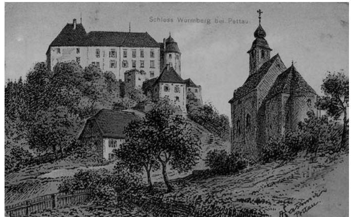
Grad Vurberk pri Ptuj.

lami Kmetijskemu oddelku Okrajnega ljudskega odbora Ptuj (dalje OLO Ptuj). Iz spodnjih delov gradu so namreč nameravali urediti učiteljska stanovanja in prosvetni dom, medtem ko bi preostali material razdelili revnemu prebivalstvu za popravilo in gradnjo poslopij. Omenjena prošnja je bila v tem času posredovana še Narodni vladi Slovenije. 10 KLO Vurberk je 23. 1. 1946 pisal Upravi državnih posestev Ministrstva za kmetijstvo Narodne vlade Slovenije in prosil za dodelitev gradu ter podal natančnejše načrte o tem, kakšne namene ima z njim. Grad bi renoviral in v njem uredil prosvetno dvorano z gledališkim odrom, čitalnico s knjižnico, učiteljska stanovanja, prostore za gospodarsko in gospodinjsko nadaljevalno šolo, medtem ko bi preostale prostore uredil v prometne namene. Prošnjo sta podprli še Osvoobodilna fronta Vurberk in šolsko upraviteljstvo Vurberk. 11 Omenjeno ministrstvo je grad kot celoto že odpisalo. V dopisu 28. 9. 1945 je Zavod za varstvo in znanstveno proučevanje kulturnih spomenikov in prirodnih znamenitosti Ljudske republike Slovenije (dalje Zavod za varstvo spomenikov LRS) pozvalo, 12 da zaradi propada gradu odpelje še uporabne detajle, kot je recimo vodnjak. 13 KLO Vurberk je 19. 2. 1946 ponovno pisal OLO Ptuj, da je grad v takšnem stanju, da se ga več ne izplača obnoviti, saj kolikor ga je ostalo nepoškodovanega in bi se ga dalo obnoviti, ga »oblasti demontirajo in odvažajo«. 14 21. 2. 1946 je Ministr-