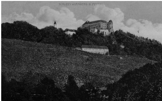
Grad Vurberk pri Ptuju.

gradu in te so ga zgolj predložile MMP, ki ga je potem po vnaprej določenih postavkah zaračunal. V kroniki Ljudske šole Vurberk obstaja zapis iz leta 1955, ki sporoča, da gradu več ni, saj obstajajo zgolj še temelji, ki molijo v zrak. Tega leta naj bi padle zadnje stene, medtem ko si je okoliško prebivalstvo iz ostankov grajskega kompleksa zidalo hleve in obnavljalo hiše. Pri pridobivanju gradbenega materiala ni bila izjema niti Ljudska šola Vurberk, saj so za obnovo starega šolskega zidu ob glavni cesti uporabili material iz ostankov gradu. 105