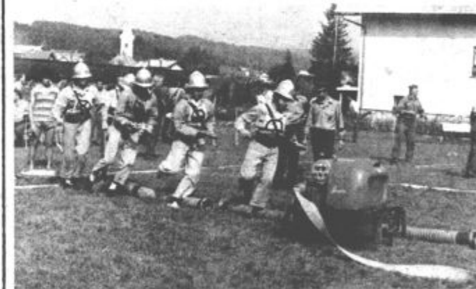
Na tekmovalju gasilskih desetini za pokal krajevne skupnosti Šmartno ob Paki je nastopilo 28 desetini.

Zmagovalne ekipe so prejele pokale, ki jih je za moško desetino dala krajevna skupnost Šmartno ob Paki, pokrovitelj ženskega dela tekmovalja je bila Era- Tozd Vno Šmartno ob Paki, za mladince pa je pokal prispevala osnovna organizacija ZSMS iz tega kraja.