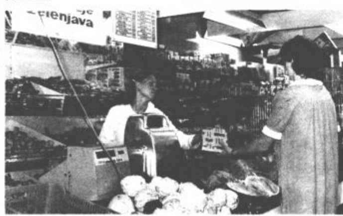
Pogled na zelenjavo je bistveno drugačen kot na meso

narijev, v Velenju pa 327,67 dinarijev. Za enaka živila bi morali v sredo, 27. julija, v Mozirju odšteti 1383,85 dinarijev, v Titovem Velenju pa 1369,84 dinarijev. Jasno je torej, da je treba danes samo za kilogram svinjskega mesa odšteti več, kot smo za košarico, napolnjeno s petnajstimi živil, pred petimi leti.