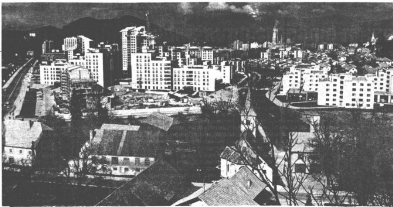
Vsak košček zemlje je potrebno racionalno izkoristiti

Prostorski del družbenega plana občine Velenje