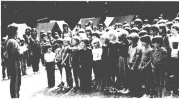
Taborniška zaprisega najmlajših

Naslednji dan jih je čakalo novo presenečenje, nočni orientacijski pohod. Za najmlajše je bila to nova dogodivščina. Seveda so naslednji dan odpravili na izlet v Bled, popoldan pa so se lahko še kopali. Zadnji dan pa je vse nove tabornike čakal še taborniški krs. Tako je potekalo letošnje taborjenje v Ribnem pri Bledu. Veliko tabornikov je odšlo domov, vodniki pa so si napravili nahrbtnike in odšli peš na dvojna Triglavka jezera. Hodili so dva dni in prepešali preko 40 km. Tretji dan so se vrnili v dolino. Dekleta-vodnice so nadaljevale pot z avtomobilom, fantje pa so pot nadaljevali s kajaki po Savi Bohinjki. To svojo tridnevno pustolovščino so poimenovali podaljšana varianta 83 in se dogovorili, da bodo prihodnje leto akcijo ponovili v drugačni smeri. Aleš Ojsteršek