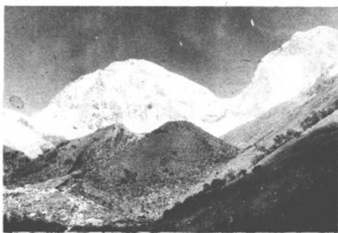
SV ostenje Huaskarana, ki je bil naš cilj

Naenkrat se cesta ostro obrne in belih vrhov v glavnem zmanjka. Tudi klima se tako nekako spremeni, prihajamo v toplejše kraje, ki postajajo tudi vedno bolj poraščeni. Pičje petje mi gre že na živce, pa še venomer se spotikam, ko opazujem živobarvne ptice, ki mi kar naprej letajo izpod nog.