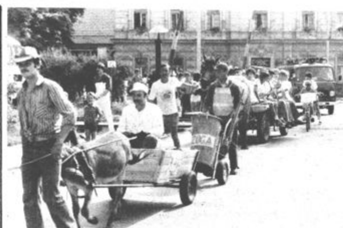
Vse ekipe so se zbrale na Trgu svobode, od koder je pisan sprevod vozil, ljudi in živali krenil po šoštanjkih ulicah na igrišče

Na tekmovalju smo posneli nekaj fotografij, ki jih objavljamo.