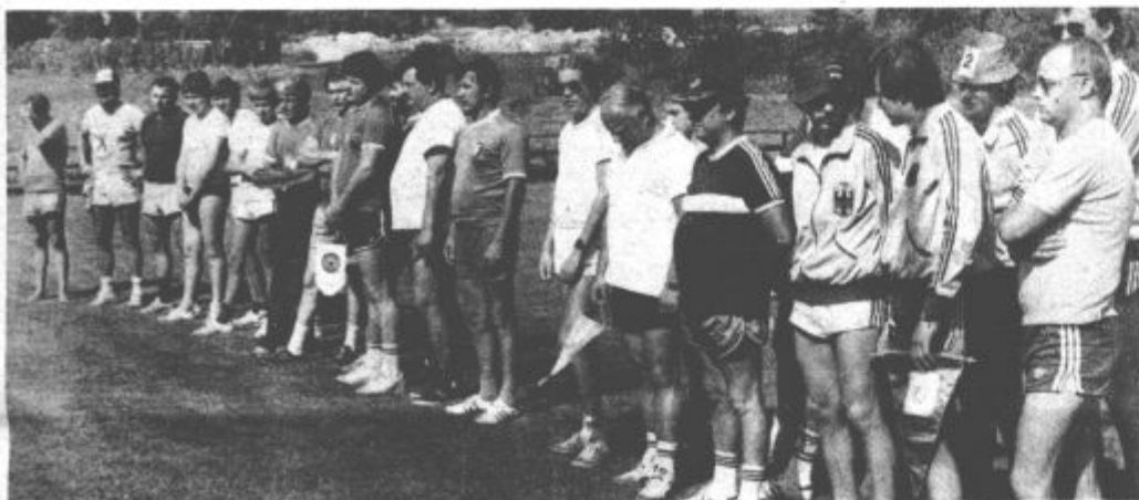
Slovesna otvoritev tekmovalja