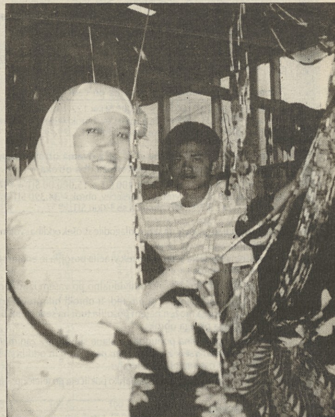
Tovarna svile v Garutu na Javi