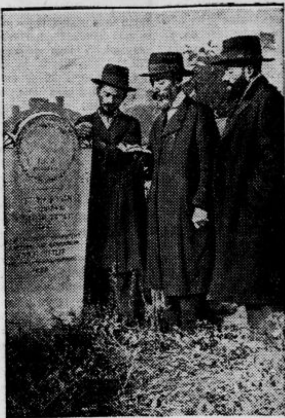
V Bukarešti so odkrili na ondotnem pokopališču grob s ploščo, ki pravi, da je tam pokopan 20. oktobra 1892. umrl Adolf Hitler. Pokojnik je bil... židovskega rodu