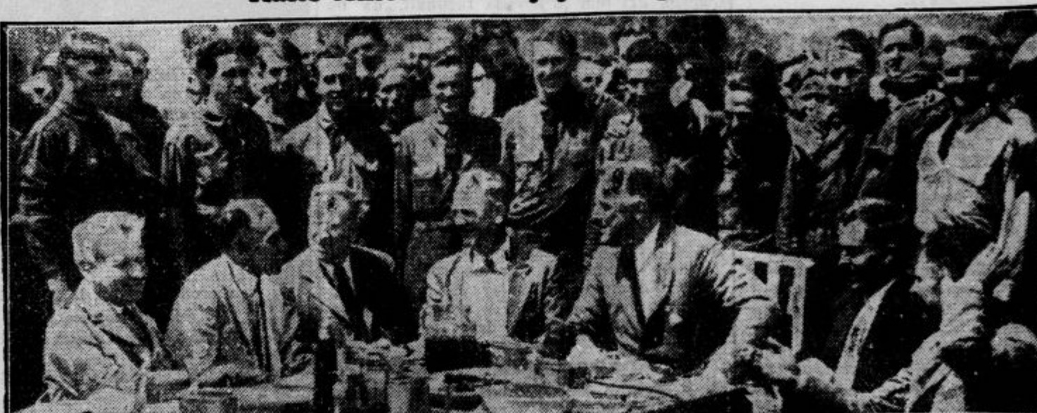
Predsednik zedinjenih držav Roosevelt na otvoritvi enega izmed 1463 novih taborišč za delavce. V teh taboriščih bo ameriška vlada koncentrirala nad 300.000 brezposelnih, ki jih bodo zaposlili pri gradnji 80.000 km novih cest in železniških prog, 15.000 km telefonskih vodov, pri osuševanju močvirij, pogozdovanju golčav itd. Povprečna tedenska plača takšnega brezposelnega bo 30 dolarjev