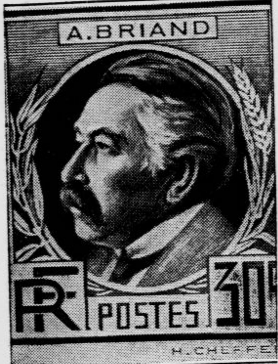
Je izdala francoska poštna uprava znamko za 30 centimov