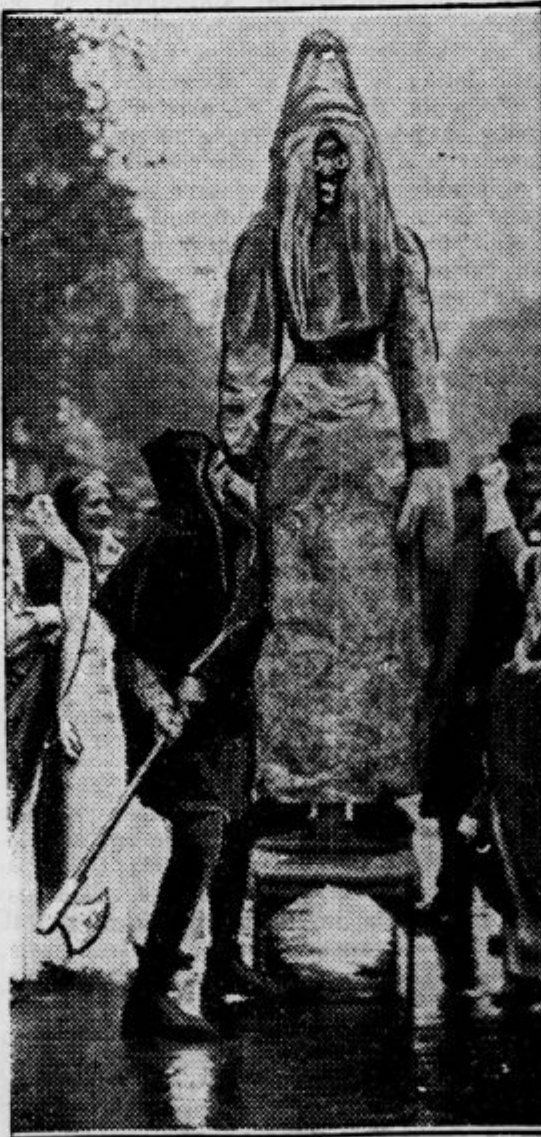
Na neki prireditvi v Parizu so usmrtili tole simbolično figuro krize