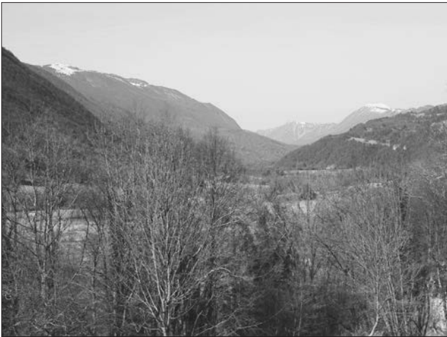
Pogled iz vasi Gabrje proti Matajurju (zasnežen vrh levo) in Stolu (zasnežen vrh desno v daljavi).