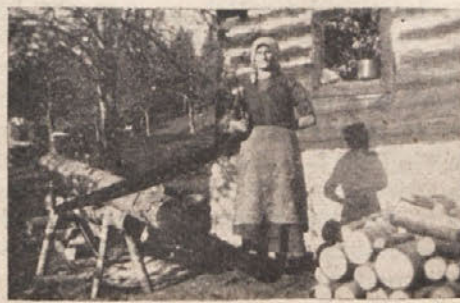
Mama zna vse.

Naše mame. Tokrat nas je razveselil z originalno fotografijo naš prijatelj iz celovške okolice. K sliki je pripomnil uprav duhovito: Mama zna vse! Da, mama zna vse! Ona skrbi za svojo družino in ji žrtvuje svojo srčno kri vse dotlej, da se zgarana zgrudi na