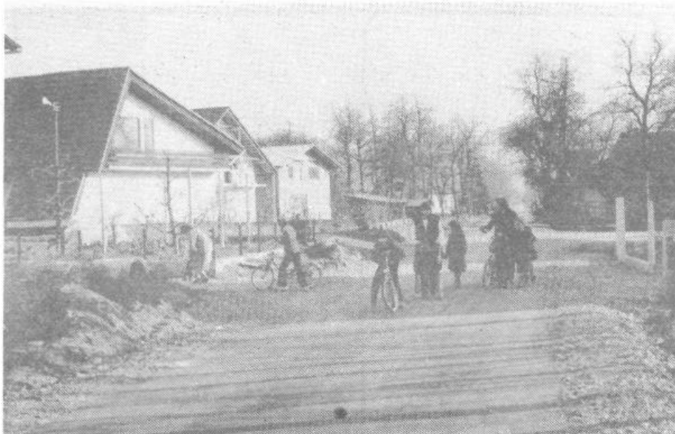
Naselje Gmajna v KS Notranje Gorice je dobilo asfaltirano cesto. Prav pa bi bilo, da bi zanj vsi prispevali dogovorjeni znesek.