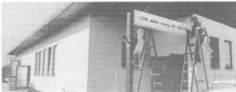
Prej je bila kot vsaka druga montažna hiša, zdaj, z napisom, pa je postala tudi uradno dom krajanov KS Galjevica. In to je res njihov dom, saj so ga zgradili z lastnim delom in le z nekaj pomoči iz občinskega žaklja.