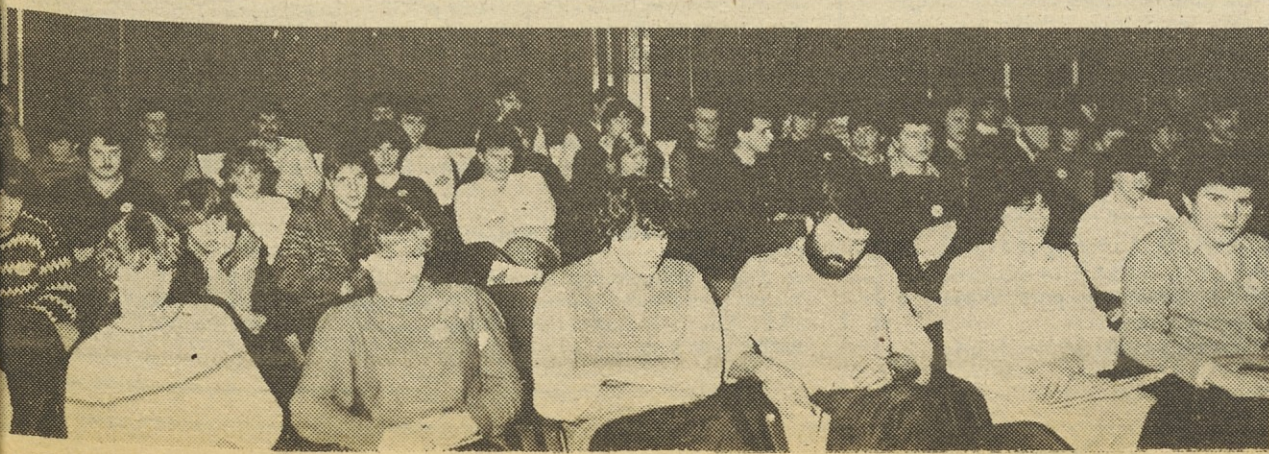
Med goščanim mladim SOZD Iskra v Rabcu

V okviru tega zasedanja so člani madžarske delegacije v četrtek, 19. t.m. obiskali tudi delovno organizacijo Avtomatika. Med razgovori, ki so jih imeli s predstavniki delovne organizacije, so se gostje podrobneje seznanili s proizvodnim programom in možnostmi za povečanje sodelovanja. Dogovorjen je bil tudi nadaljnji potek razgovorov na tehnični ravni. Hkrati so svoj program predstavili tudi predstavniki delovne organizacije Iskra-Industrija elementov in delovne organizacije Iskra-Kibernetika. Razgovorom je sledil ogled proizvodnje v TOZD Avtomatika in varilne naprave in TOZD Naprave za energetiko.