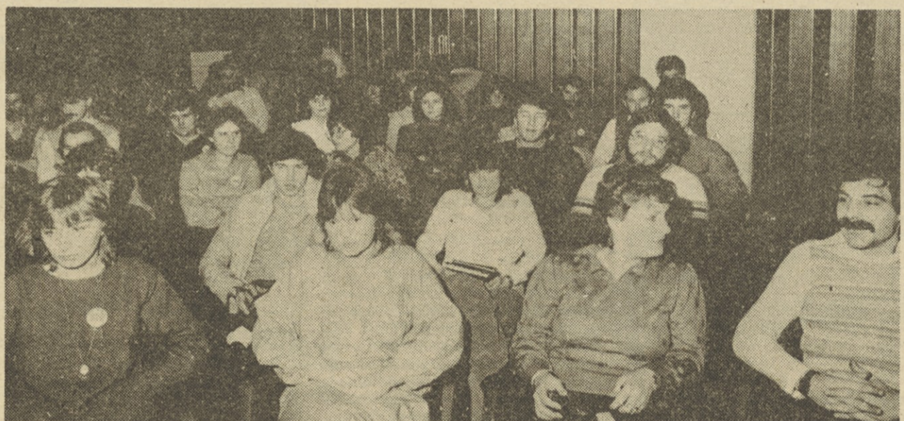
Mladi so pozorno spremljali potek delovnega srečanja.

stih in vlogi temeljnih organizacij v okviru delovnih, marsikje so še nerešena vprašanja med delovnimi organizacijami, pa tudi med DO in sestavljenimi organizacijami. V prvi vrsti gre za vprašanja, ki jih povzročata morda pre malo jasna