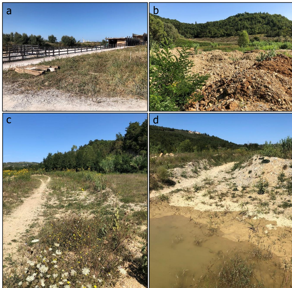
Slika 2. Lokalitete v Slovenski Istri, kjer je bila aprila in septembra 2020 opazovana kobilica selka Locusta migratoria : (a) Naravni rezervat Škocjanski zatok pri Koprju (Lok 1b), (b) območje ob odlagališču odpadkov jugovzhodno od vasi Dragonja (Lok 4b v ospredju, 4a v ozadju), (c-d) območje ob glavni cesti Koper-Dragonja, severozahodno od Padne (Lok 3).

V zgodnjem popoldnevu je bil z opazovanjem treh samcev in štirih samic kobilice selke nagrajen še obisk redko poraščenih ruderalnih površin ob glavni cesti Koper-Dragonja, severozahodno od Padne (Tab. 1, Lok 3; Sl. 2c in 2d, Sl. 3b in 3c). Ob kobilici selki so bile na območju posamič opazovane še modrokrila peščenka, hrumeča poletavka, laška kobilica in egipčanska kobilica.