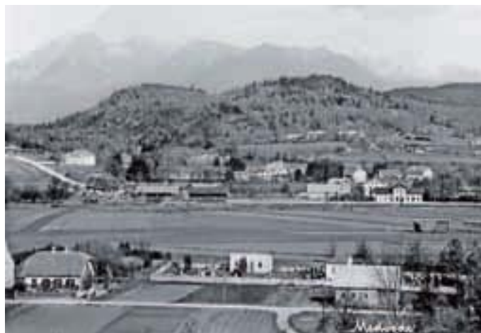
Levo v daljavi se vidi stari jekleni most na Gorenjski cesti, ki so ga postavili sočasno z izgradnjo nove ceste Ljubljana-Kranj leta 1936 ...