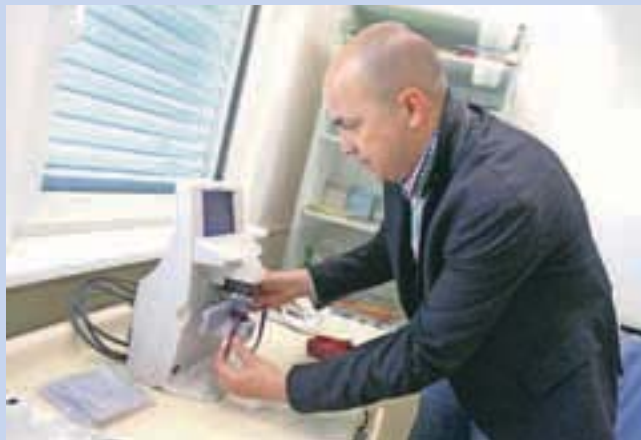
V okulistični ambulanti Zdravstvenega doma Medvode so bogatejši za sodobno napravo za merjenje dioptrije na korekcijskih steklih.