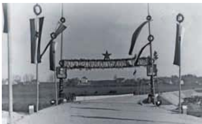
... na mestu katerega so v času socializma leta 1947 zgradili nov most, ki stoji še danes.