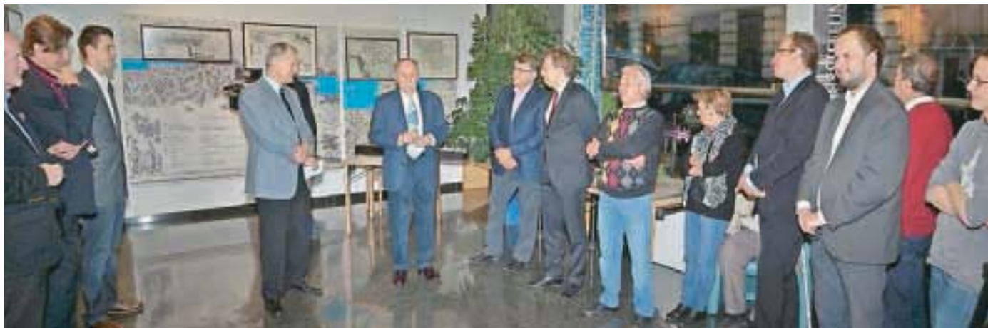
Medvode so v začetku maja predstavili v Slovenskem kulturnem centru Korotan na Dunaju.