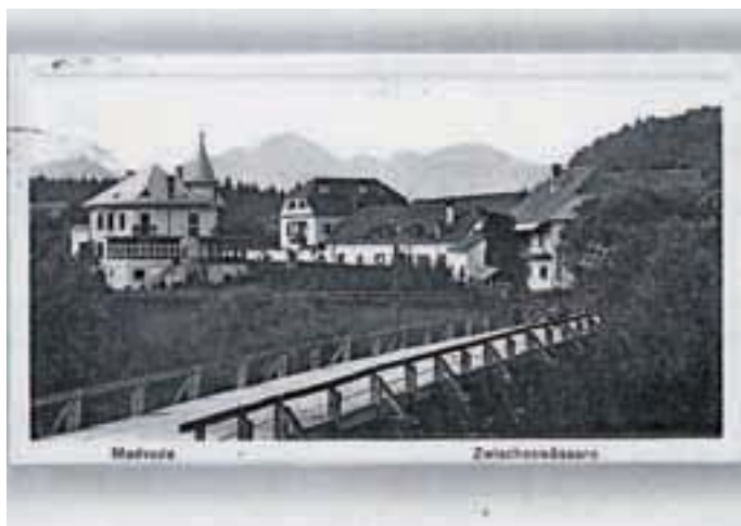
Stari leseni most pri današnji občinski stavbi

so ga razopažili. Zanimiva zgodba je povezana še z jeklenim mostom na Gorenjski cesti, ki so ga zamenjali po komaj desetih letih od odprtja zaradi potreb pri gradnji elektrarne v Medvodah. Mateja Rant