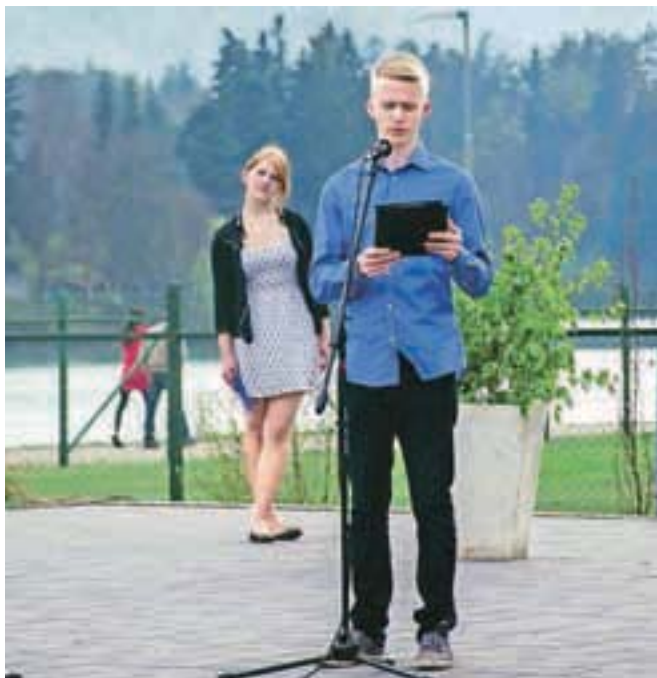
Mladinska sekcija TD Zbilje je poskrbela za prijetno pomladno kulturno popoldne ob Zbiljskem jezeru.

Mladinska sekcija Turističnega društva Zbilje je v začetku aprila organizirala svojo prvo kulturno prireditev, ki je potekala v duhu poezije Simona Jenka.