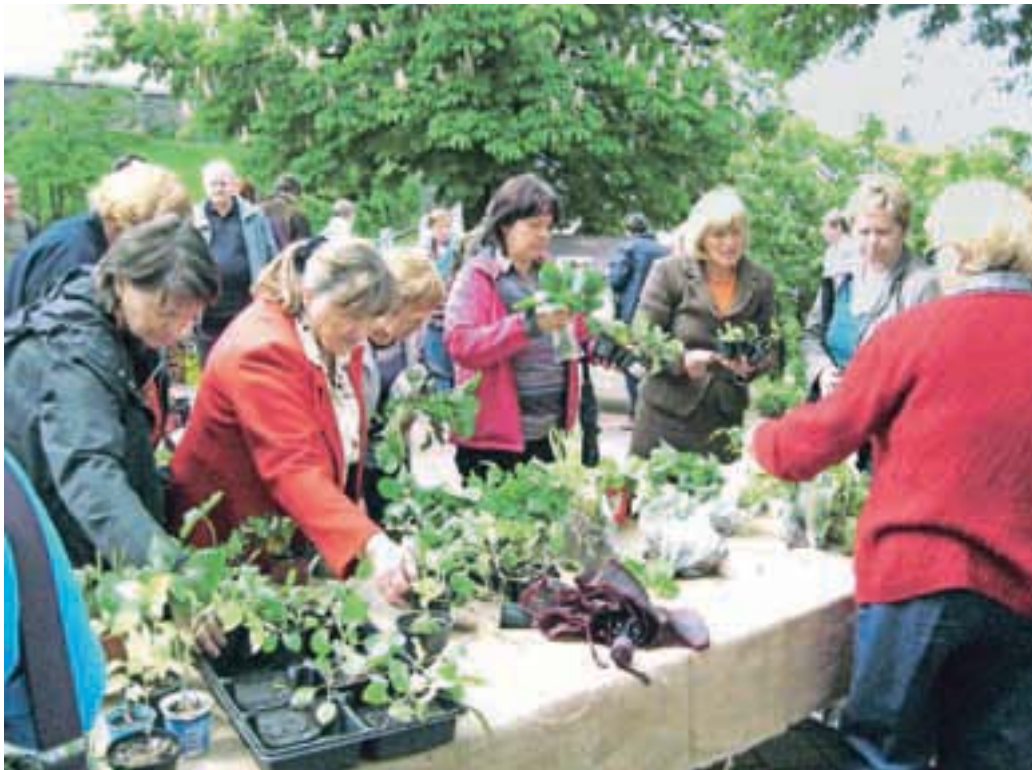
V Smledniku ohranjajo tradicijo izmenjave doma pridelanih sadik oziroma flanc.