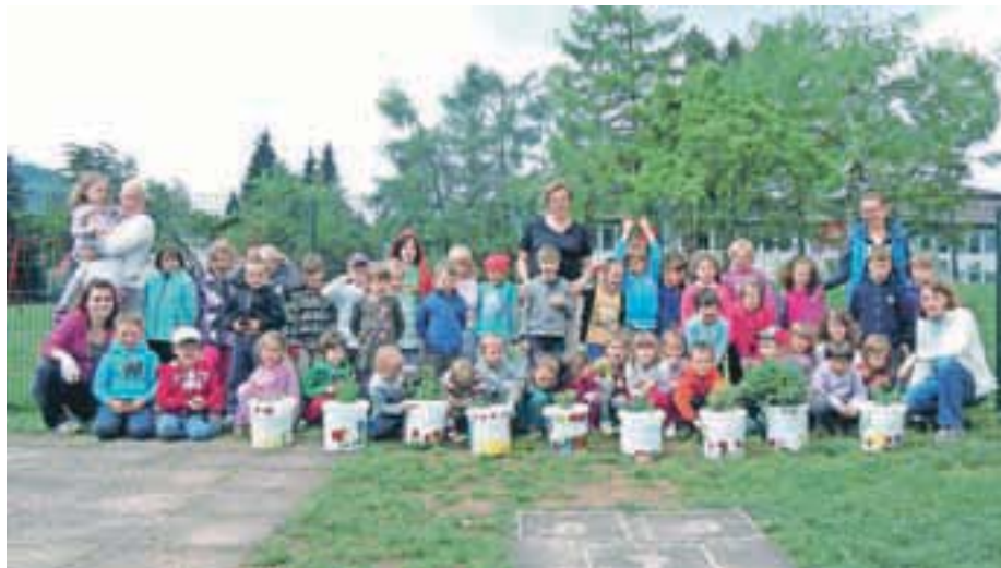
Dan zemlje so v medvoških vrtcih zaznamovali z različnimi dejavnostmi.