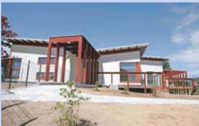
Gradnja vrtca v Pirničah je že skoraj končana.

»Letos smo prejeli 259 vlog, v vrtec pa smo sprejeli 181 otrok. Razpisali smo tudi prosta mesta za razvojni oddelk. Prispela je samo ena vloga, zato oddelka letos še ne bomo odprli.«