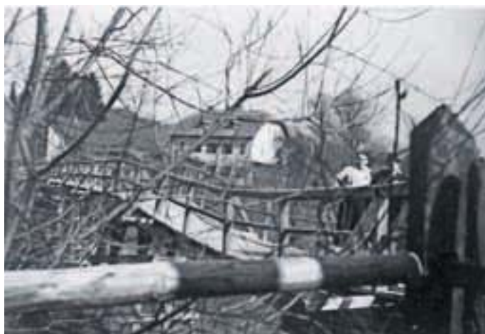
... na njegovem mestu pa so zgradili začasno brv (če kdo pozna osebi na fotografiji, naj nam, prosim, javi v uredništvo, da bomo prihodnjč objavili njuni imeni).