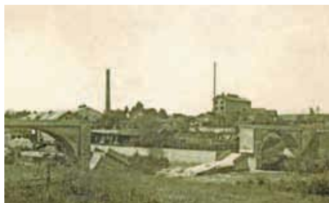
Most v Goričanah, ki so ga zgradili leta 1936, se je zrušil takoj, ko so ga razopažili.