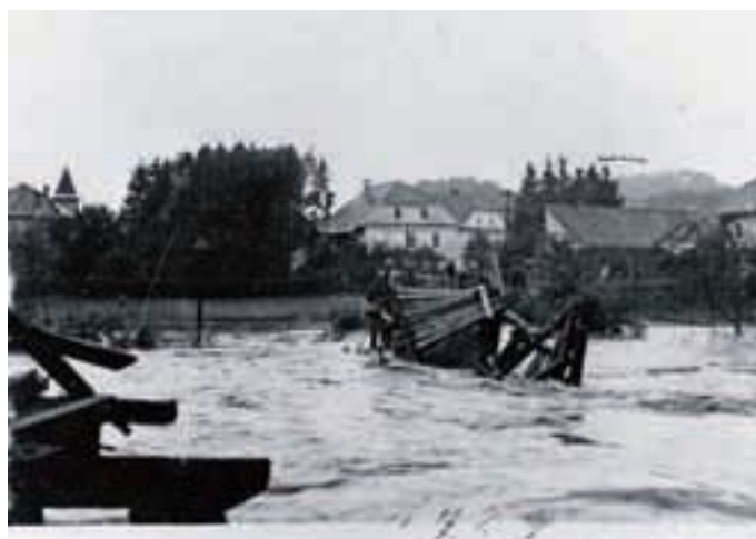
Leta 1929 ga je odnesla narasla voda ...