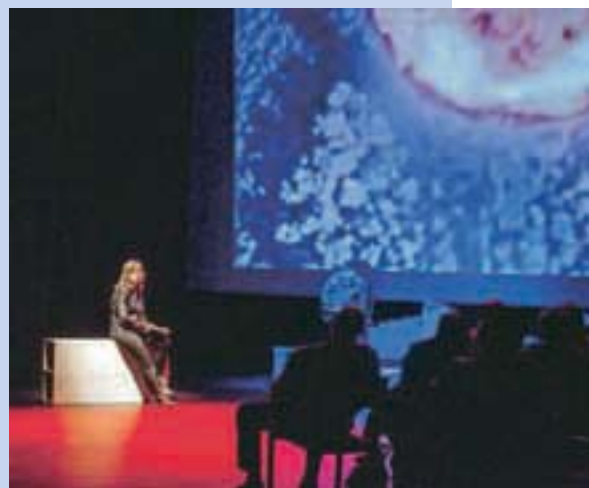
Šel je popotnik skozi atomski vek: uspešno sodelovanje treh sekcij KUD-a Pirniče

Sicer pa gledališčniki iz Pirnič vabijo, da se jim v soboto, 24. maja, pridružite na tradicionalni gledališki karavani, ki jo organizirajo že več kot 25 let. Letos se bodo podali na raziskovanje kulturnih in naravnih znamenitosti Podčetrtna in Kozjanskega, karavano pa