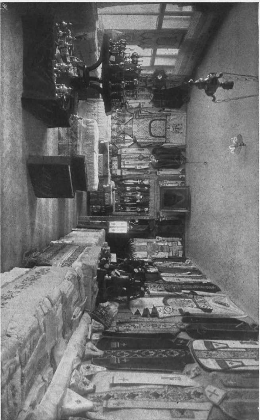
Evharistična misijonska razstava družbe sv. Petra Klaverja na Dunaju od 7 do 18 kimovca 1912 (glej št. 11 stran 161).