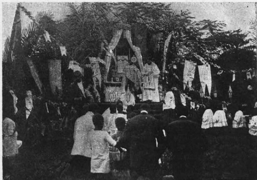
Evharistična procesija v Afriki. Misijskar podeli množici sv. blagoslov.