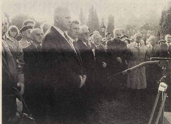
Udeležba pri proslavi je bila precejšnja

večnarodni sestav partizanskih enot predvsem na področju Svinjske planine, ki so ponese baklo antifašizma in zanetile partizanski upor severno od Drave. Luc je govoril o neminljivih zaslugah koroških partizanov za vzpostavitev demokracije v Avstriji, kajti borili so se proti ideologiji in režimu, ki je industrijsko uničevanje ljudi naredil za enega od svojih osrednjih ciljev in ki bi v primeru zmage pahnil Evropo in svet v temo in barbarizem. Predvsem pa je predsednik Zveze partizanov pozval vse k budnosti in čuječnosti pred vsemi pojavi neonacističnega nasilja, ki je svoj ostudni obraz že pokazalo s pisemskimi bombami.