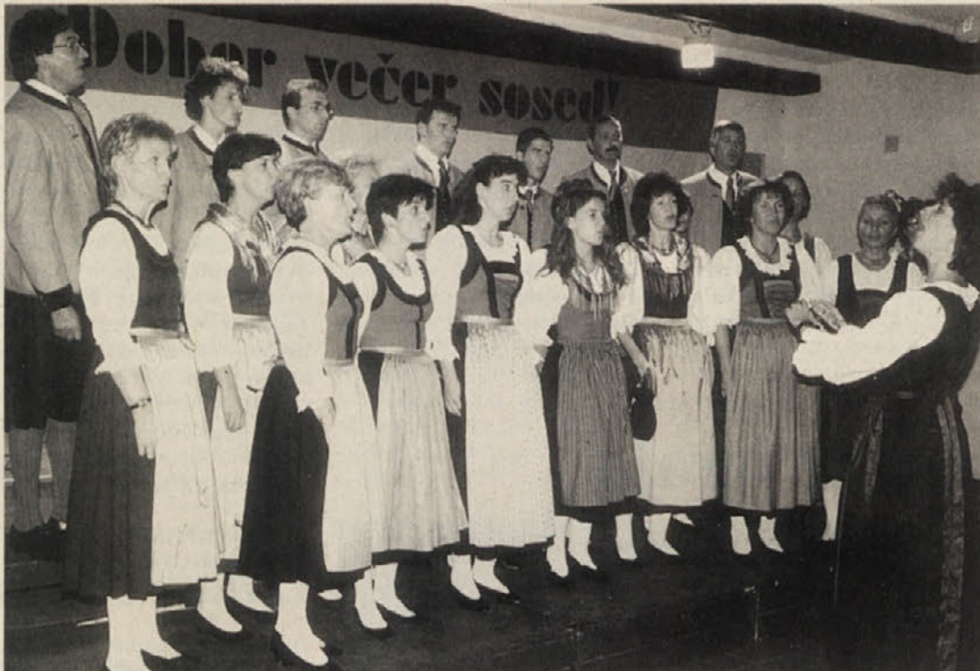
V gosteh je bil vokalni ansambel iz Velikovca