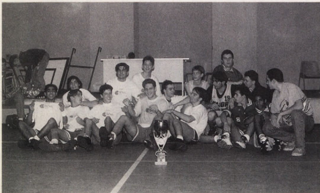
Mladi odbojkarji s prehodnim pokalom na srečanju v Trstu