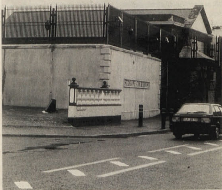
IRA je napadala predvsem gostilne, kjer so se srečevali britanski armadni vojaki, policijske postaje, kakršna je zgoraj na sliki, pa so bile in so še zavarovane kot utrjeni bunkerji.