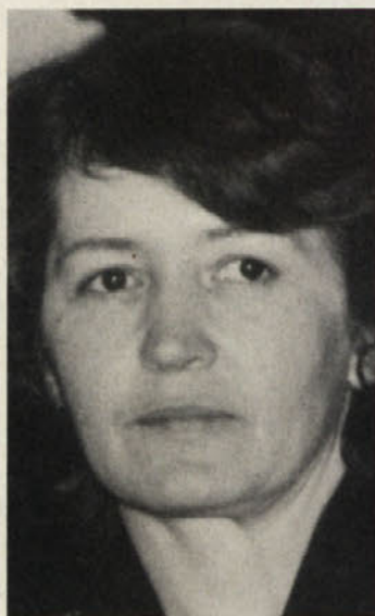
Piše Sonja Wakounig