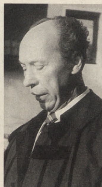
Gen. konzul Vasilij A. Kupcov

odnosi med ljudmi preprečujejo sovraštvo in kot posledico tega vojne ter vojaške spopade.