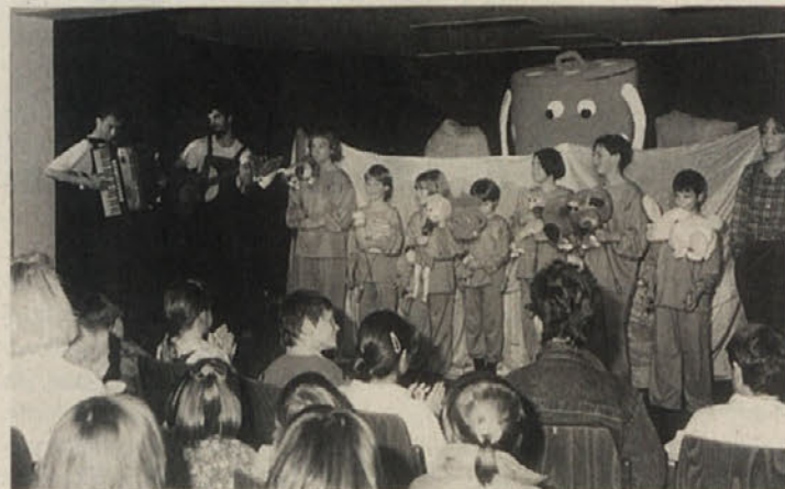
Zadovoljni so mladi igralci poželi aplavs

»Čarobni piskrč« je ena od mnogih inačice koroške pravljice Mojca Pokrajculja. Spraševali so starejše Ziljane, sestavili tekst, napisali pesmice, ki jih je uglas-