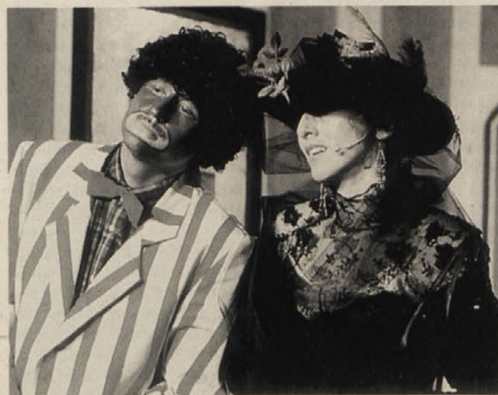
Premiera musicla je danes ob 19.30 v Šentprimozu!