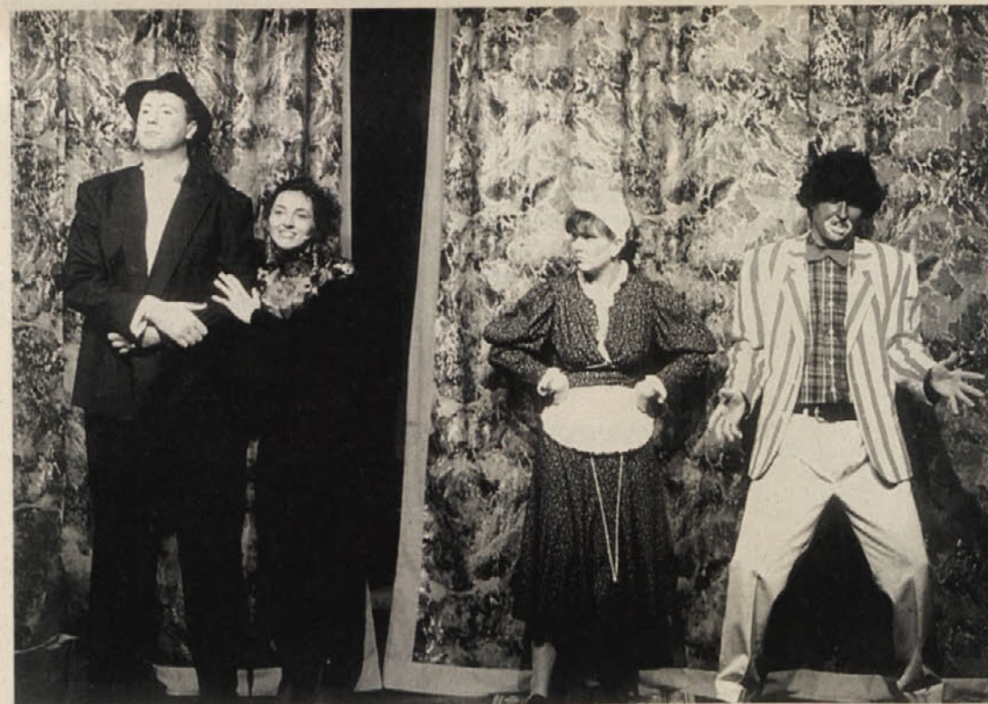
Prizor iz musicla »Pokojna gospejina mama«