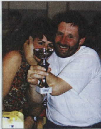
Zmaga je sladka.