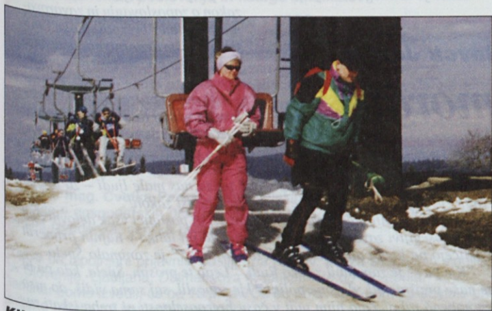
Kljub pomladanskemu vremenu so bili pogoji za smuko dobri.

tinsko-turistične delavce spodobi, potekalo v zelo veselem razpoloženju, kar pa ne pomeni, da ga nekateri niso vzeli presneto zares. Zato so lahko navijači spremljali lepo smuko in športno borbo za pokale, kar je omogočalo tudi izvrstno pripravljeno smučišče.