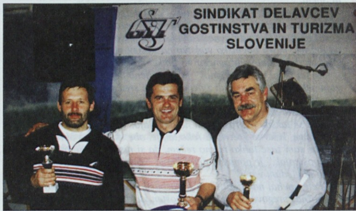
Najboljši so prejeli pokale in nagrade.