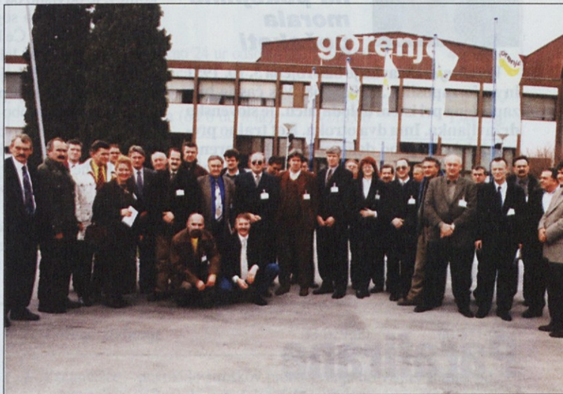
Med obiskom Gorenja so udeleženci seminarja skupinsko pozirali.

litve, sami zapustili podjetja kovinske industrije. Podjetja, ki so bila bombardirana, ne delajo s polno zmogljivostjo. Zaradi sprememb, do katerih bo prišlo po privatizaciji, pa je prva naloga sindikata ohranitev podjetij in delovnih mest v njih. Pri tem se bo sindikat moral spopasti z vlado, ki načrtuje veliko spremembo privatizacijskega zakona iz leta 1997. Ta je bil za delavce dokaj ugoden, saj bi na njegovi podlagi brezplačno dobili 60-odstotni lastniški de-