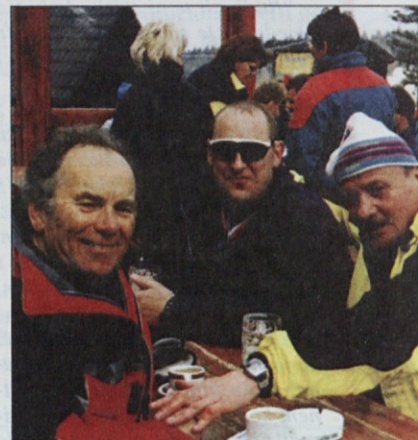
Klepet med prijatelji.