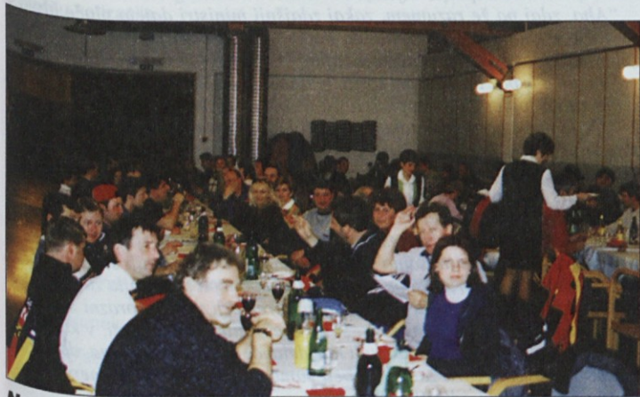
Na srečanju se je zbralo več kot 100 tekmovalcev in navijačev.