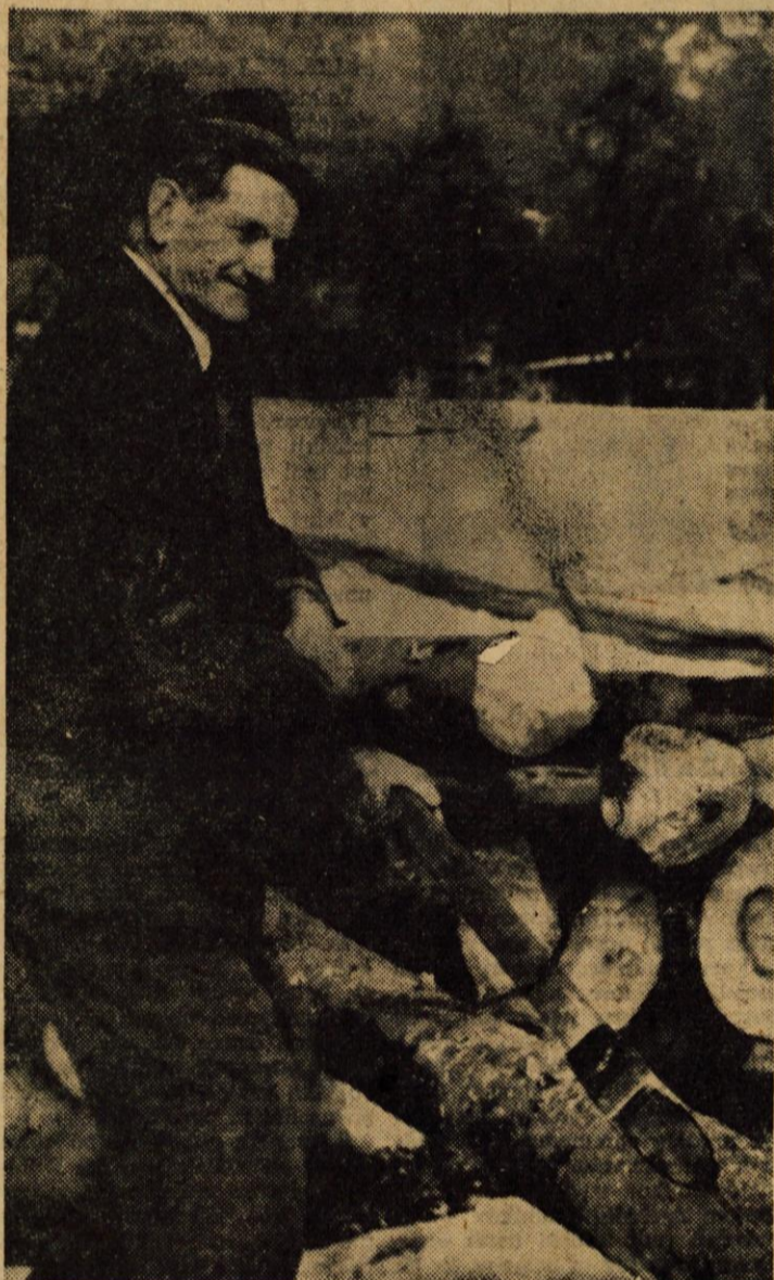
Težko delo pri pripravi lesa