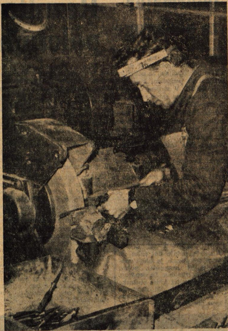
Mizarsko dletu iz tega brusilnega stroja v Tovarni kos in srpov v Trčiču bo dobilo dokončno podobo še v lakirnici

V jeseniški železarni je že nekaj let klub mladih proizvajalcev, ki ima za leto 1964-65 posebno bogat program dela. Mlade člane kolektiva bo seznanil z bogato tradicijo železarstva v jeseniški kotlini oz. njenim nastankom od fužin v Bohinju do Savskih jam nad Jesenicami. Da bodo spoznali mladi proizvajalci celoten krog proizvodnje, bodo organizirali medsebojne obiske med ekonomskimi enotami. Proučevali bodo tudi socialne probleme na Jesenicah in njihove vplive na proizvodnjo ter psihologijo dela in medsebojne delovne odnose na posameznih delovnih mestih. Prav posebno pozornost pa bo ta klub posvetil novogradnji na Belškem polju — kamor bo organiziral več strokovnih ekskurzij — vlogi raziskovalnega oddelka in njegovemu vplivu na kvaliteto proizvodov itd. Baval se bo tudi s podrobnimi študijami rekonstrukcije plavža, žične valjarne ter s problematiko in reorganizacijo nekaterih obratov in oddelkov. Delovanje kluba bo v letošnjem letu lep prispevek k strokovni izpopolnitvi mlajših članov delovnega kolektiva jeseniške železarne, kar zahteva rekonstrukcija podjetja in kar je v sklopu priprav na bližajočo se stoletnico obstoja in uspešnega delovanja ter velikega razvoja Železarne Jesenice.