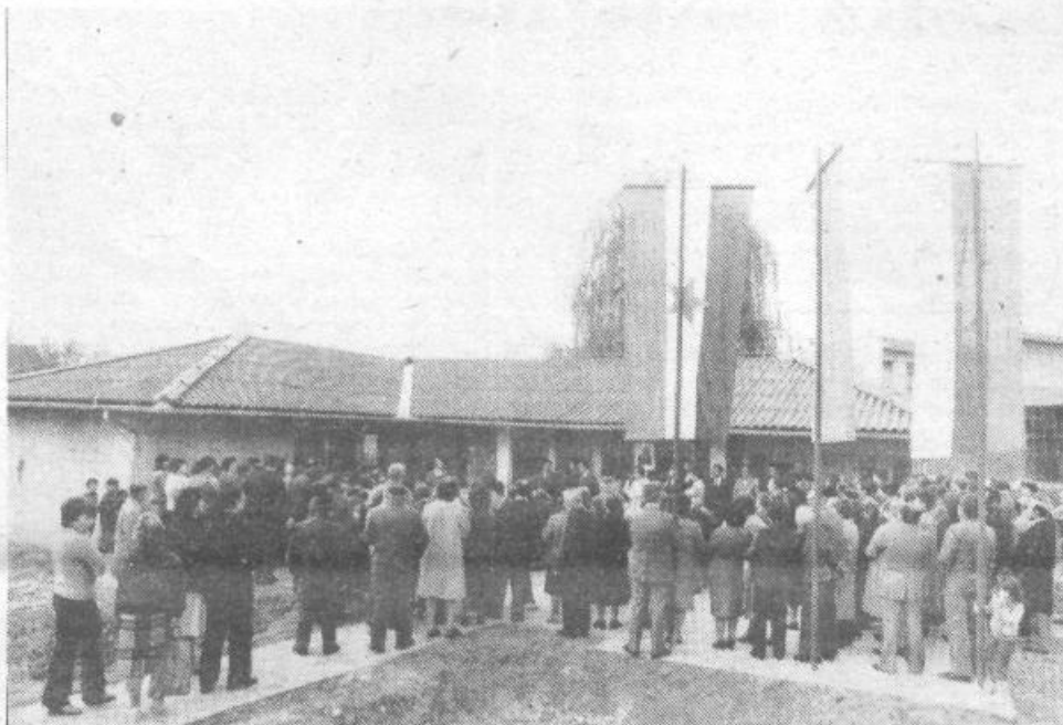
Slavnostna otvoritev doma krajanov KS Stane Sever.