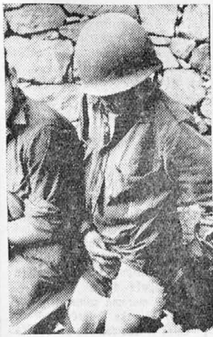
Angloameriška ujetnike na zahodni fronti obvezujejo nemški sanitetci, nato pa so ujetniki odposlani v zbiralna tebarišča

Dosedaj smo doživeli v nekakšni dobi liberalizma, ki je na socialnem polju žalostno odpovedal, saj ravno v deželah največjih bogastev, kakor v Franciji, Angliji in v Ame-