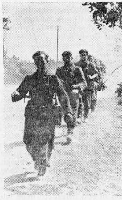
Nemški grenadirji korakajo po prašni gramozni cesti na zahodnem bojišču v ukazani jim protinapad