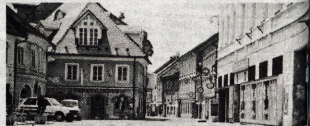
Kranj 2. in 13. julija 1991 - Objektiv našega fotoreporterja Jure Ciglerja je z istega mesta zabeležil utrip v centru gorenjske metropole, Kranju: prva slika je nastala 2. julija ob 16. uri ob alarmu zaradi nevarnosti letalskega napada, isti dan dopoldne je bil raketan oddajnik na Krvavcu. Minulo soboto ob 12. uri je bil življenjski utrip spet normalen, čeprav so (zaradi običajnega sobotnega prekušanja) spet zavijale sirene. M. Va.

Predsedniki zborov Skupščine Republike Slovenije so za jutri, 17. julija, in četrtek, 18. julija, sklicali seje zborov, na katerih bodo obravnavali pomembne zakone s področja zdravstva, lekarništva, invalidsko-pokojninskega zavarovanja in obrti, kar vse je bilo že na dnevnih redih zasedanj 13. in 14. junija. Seje bodo potekale, kot je za normalno delo skupščine običajno, ločeno, na skupnem zasedanju se bodo sešli le, če bo to zahteval usklajevalni postopek. ● Š. Ž.