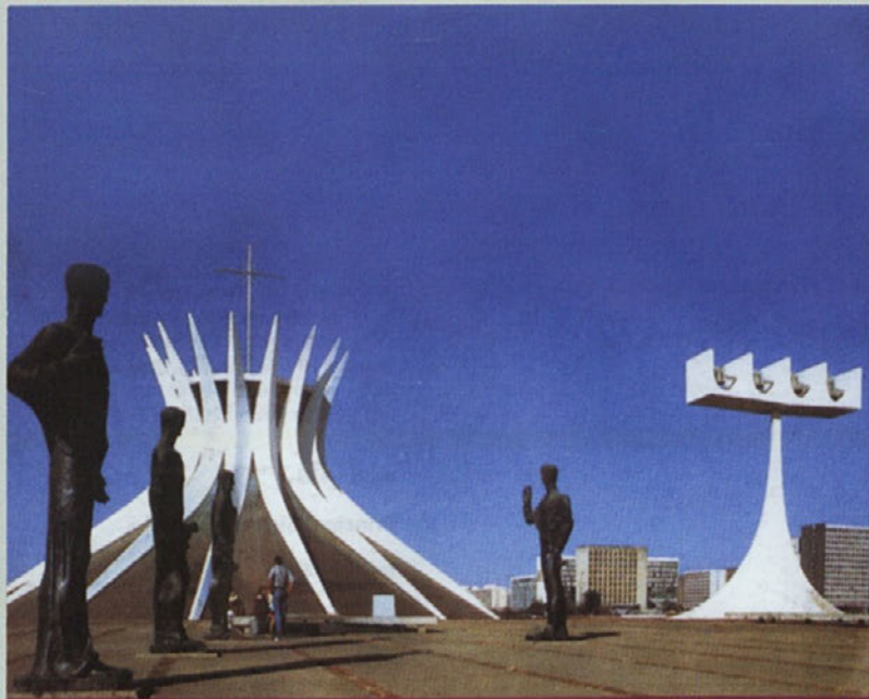
Brazilija – stolnica