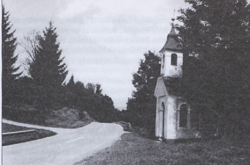
Motiv iz Bele Krajine, dežele sonca in grozdja ter izrednih lepot. Bela Krajina je bila prva republika partije, nasilja, krivic in umorov.