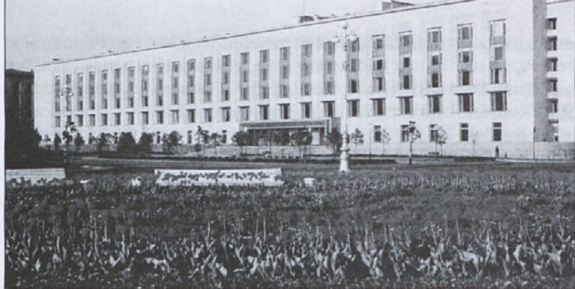
Džeržinski – center za politično instrukcijo v SZ.