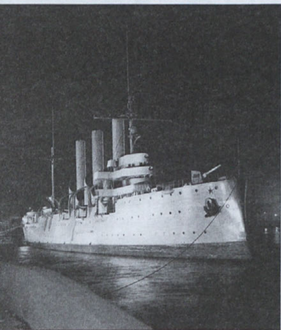
Ladja Aurora s katere topovski ogenj na zimsko palačo je bil znak za naskok boljšeševikov.

zaščite neke močne inštitucije se ni dalo preživeti. To pa je izkoristil organiziran kriminal in se izkazal za najbolj podjetnega, Poslovnež v težavah ga je najel, da bi mu pomagal rešiti njegove probleme. Običajno plačilo je bil tudi do 60-odstotni delež na dobiček, plačljiv v delnicah. Tako je kriminal dobil nadzor nad podjetjem in postal njegov solastnik. Mreža mafijskih podjetij se je nezadržno širila.