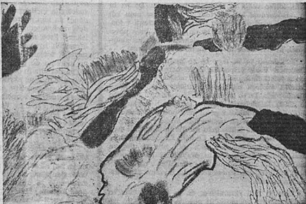
Zorka WEISS — Vrt II.