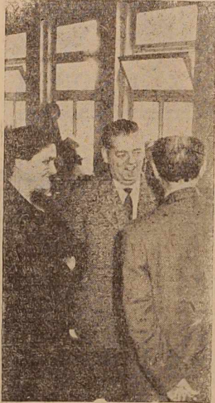
Konferenca SZDL v Radgoni

Za širše sodelovanje volivcev in članov Socialistične zveze pri odločanju o reševanju vseh važnejših problemov se čedalje bolj kot nujnost poraja bolj sistematično obveščanje občanov o vsem dogajanju o komuni. Zato bi naj bile bodoče oblike obveščanja nekaka posvetovanja z volivci o posameznih problemih. Za take oblike so se zavzemali tudi delegati, ko so ugotovljali, da so premalo seznanjeni z delom raznih organov in da zaradi tega krajevne organizacije Socialistične zveze ne morejo uveljavljati svojega vpliva.