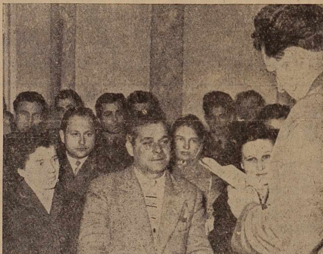
Cankova — zvečer pri studiju

prečno oceno 2,9. Skupno imamo v okraju 21.324 učencev osnovnih šol. Od teh je prvo polletje uspešno končalo 16.986 ali 79,6 odst., 19,8 odst. učencev ni izdelalo, neocenjenih pa