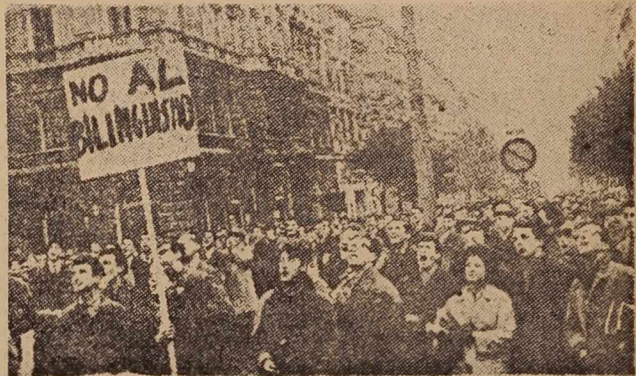
Tržaške ulice te dni

Tudi na tržaške oblasti odpade za zadnje izgredne velike odgovornost, saj so molče dovoljevale demonstracije, mirno spremljale žaljivo vzklikanje ter uradno spremljale ljudi, ki so imeli v žepih legitimacije neofašistične organizacije. S takšnim zadržanjem so oblasti vzpodbujale tisti sile, ki so preko boja proti dvojezičnosti netile revanšistični duh ter podžigale željo po sosednjih ozemljih in to celo po Reki in Dalmaciji.