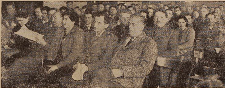
Z občinske konference SZDL v Radgoni