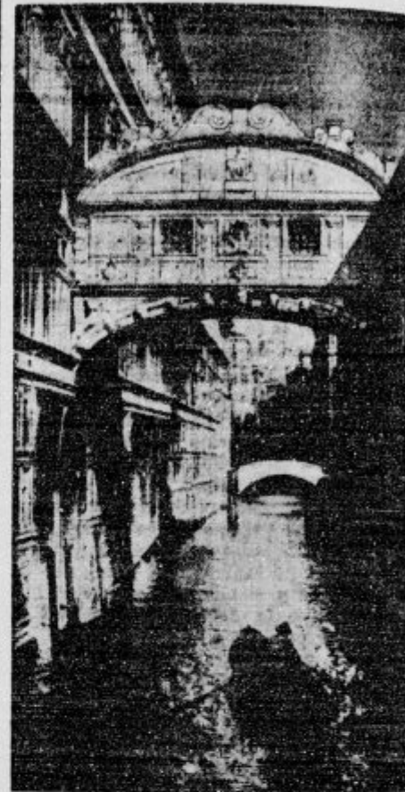
V Benetkah so okradli takozvani »Most vadinov«. Nihče ne ve, kdaj so odnesli s mosta dragoceno in težko svinčeno streho