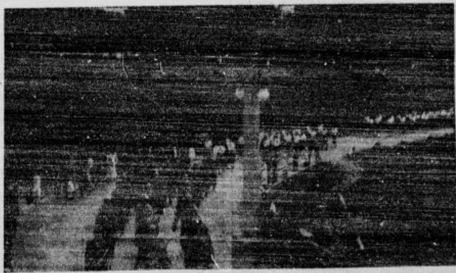
Fantje v krojlh in dekleta v slavnostnem sprevodu na prosvetnem taboru v Škofji Loki