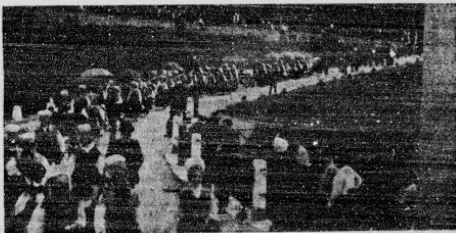
Sprevod narodnih noš na veličastnem prosvetnem taboru v Škofji Loki