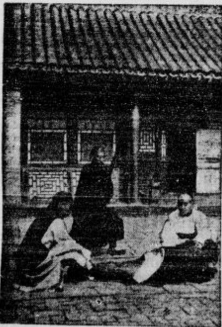
Takole kaznujejo na Kitajskem nezvesto zakonno moče