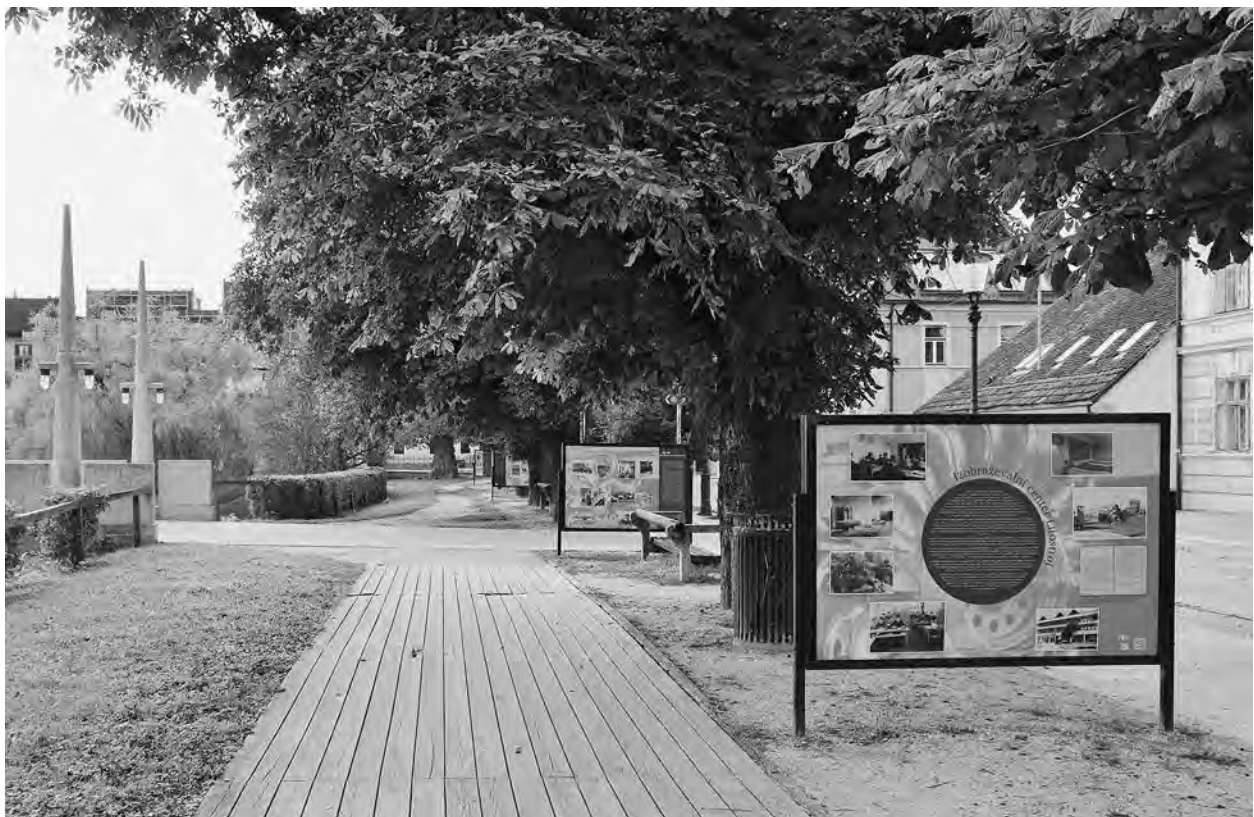
Razstava Litostroj: Nekdanji industrijski velikan v galeriji na prostem na Krakovskem nasipu v Ljubljani

Razstava Litostroj: Nekdanji industrijski velikan je bila na ogled postavljena med 19. septembrom in 21. oktobrom 2024 v galeriji na prostem na Krakovskem nasipu v Ljubljani. Nastala je v sodelovanju Zgodovinskega arhiva Ljubljana in Slovenske knjižnice – Centra za domoznanstvo Mestne knjižnice Ljubljana. Ob pripravi razstave sta tako združili moči kulturni ustanovi s skupnimi koreninami v nekdanjem arhivu ljubljanskega mestnega magistrata, pri čemer sta se povezali tudi z drugimi ustanovami, ki hranijo gradivo, povezano z bogato dediščino nekdanjega industrijsko-poslovnega sistema Litostroj (foto-