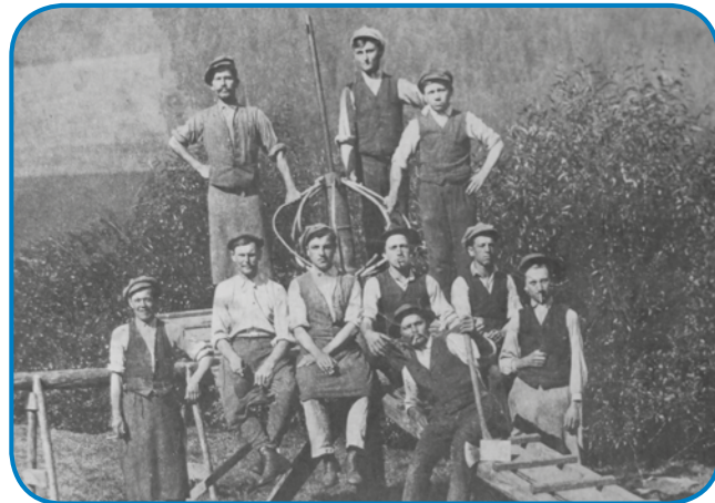
Etak so na Seniki pri mlini maust zidali