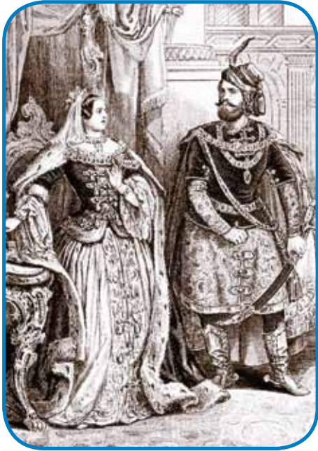
Kralica Gertrud ino Bánk bán v drami Józsefa Katone (1845)

Vogrski krau Bela III. , šteri je stvauro cistercijanski klaušter v Monoštri, je dva siná emo. Teva dva sta se dosta svajüvala, končno je na tronuš prišo starejši sin Andraš II. , šteri je v tresti lejtaj svojoga kralüvanja dale pelo ambiciozno vinešnje politiko svojoga očo, zmejs pa v rosagi vpelo globke reforme. Na začetki 13. stoletja se je v Evropi vse na glavau postavilo. Rimski pápa Inocenc III. je tak zapovedavo kralom na kontinenti, kak liki bi njini vsemogaučni oča biu, po leti 1214 pa je Rimsko-nemško cesarstvo na več stau