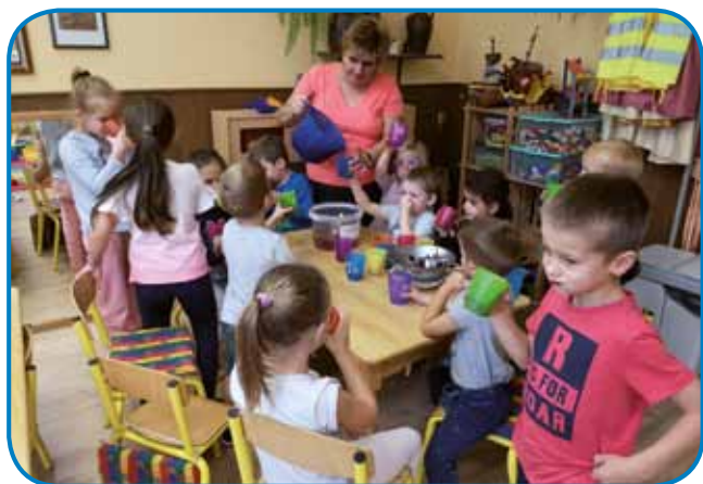
V vrtcu Monošter smo delali sok iz grozdja