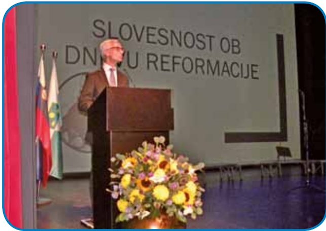
Slavnostni govornik je bil minister za izobraževanje, znanost in šport Jernej Pikalo: »Strpnost, toleranca, razbijanje predsodkov je tisto, kar nam je dala protestantska etika. To je tisto, zaradi česar smo danes kot narod drugačni, upam si reči, da tudi boljši.«