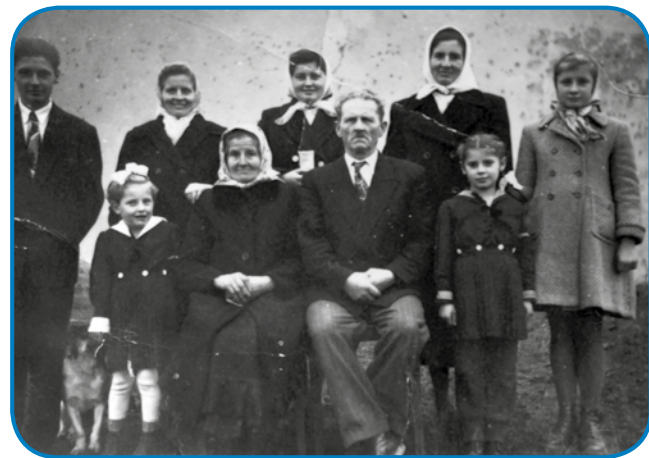
Piššana stari stariške z mlajši pa vnuki. (Piššana oča stogi prvi z lejve)

krave žené. Oča se je 1904. leta naraudo pa tam na kejpi tak šest lejt star vövidi, zato mislim, ka tau je nikak tistoga leta moglo biti. Te stari kejp je eden človek iz Graca naredo, steri je prejden biu na železniški postaji, te gda je pri nas na Seniki odo. Na ednom kejpi se vejn vidi familija tö, mlajši pa žena, pred našim ramom. Samo ka zakoj so tam pri nas