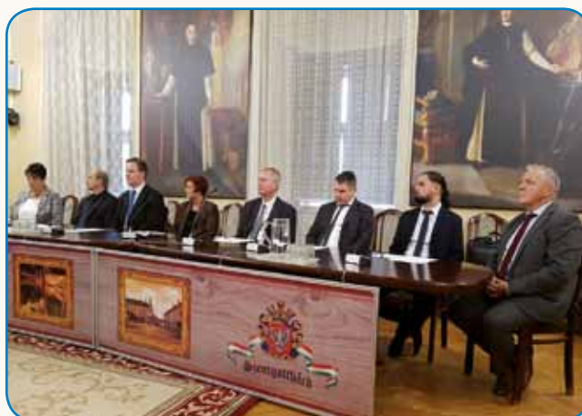
USTANOVNA SEJA MONOŠTRske OBČINSKE SAMOUPRAVE stran 6