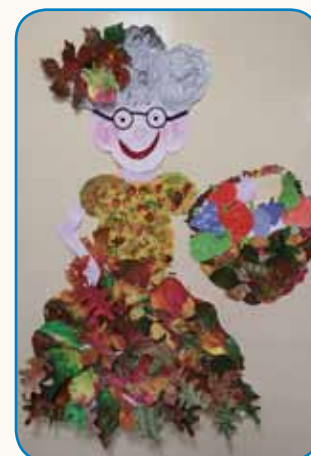
JESEN V VRTCU MONOŠTERIN SAKALOVCI stran 7