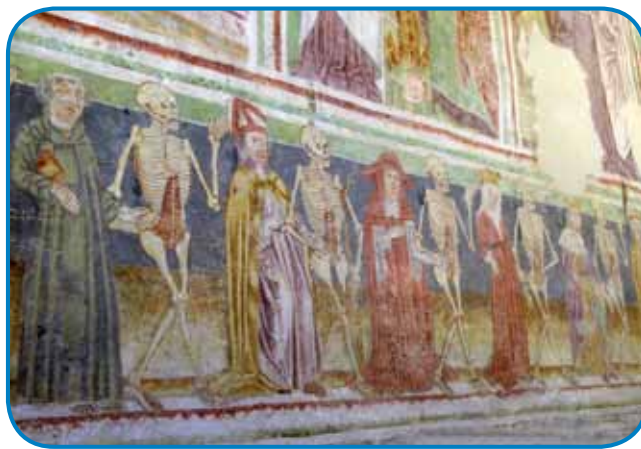
Mrtvaški ples, detajl

tua« ). Kastav je staro mesto severozahodno od Reke. Leži blizu morja na osamljeni višini, s katere je bilo v srednjem veku mogoče nadzirati trgov-