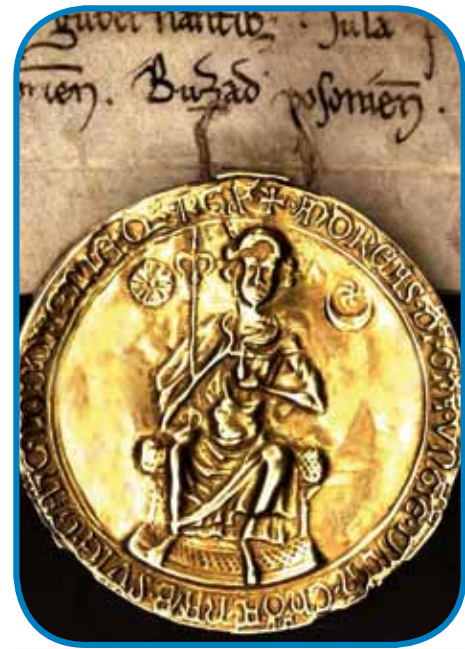
Pečatli na »Zlatoj buli« s kralom Andrašom II.

ne drži nut »Zlato bulo«. (Tau rendelüvanje so kisnej dostakrat naprejvzeli prauti tihinskim kralom, najbole prauti Habsburgom.) »Zlato bulo« dostakrat vkümejrijo z engleskov »Magnov Char-