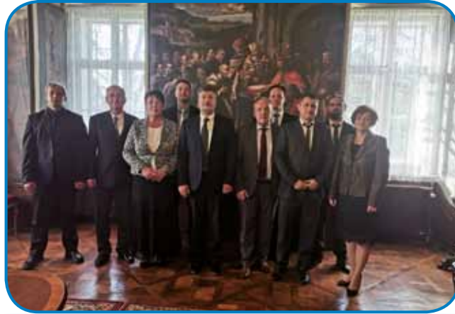
Skupna slika v županovi pisarni