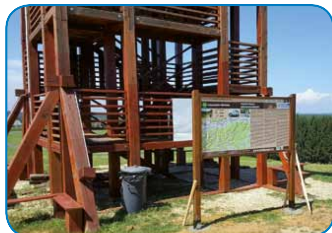
Tudi razgledni stolp na Verici je izhodišče za pohod po Porabju, ki ga opisuje informacijska tabla

»Pripravili smo obsežno podatkovno bazo znamenitosti, ki je na voljo na spletni strani guide2visit.eu . Vanjo smo vključili 250 elementov kulturne, naravne in stavbne dediščine na obravnavanem območju. Vse te informacije smo zbrali tudi v Informacijskem zvezku, ki prav tako vsebuje opise vseh kolesarskih in pešpoti,« nam je okusno opremljeno in kvalitetno publikacijo izročila projektna menedžerka in poudarila, da izvedbo projekta strokovno podpirata strateška partnerja Narodni park Őrség in Turistična zveza Železne županije. »Načrtovali smo 60-stransko izdajo, toda vseh šest partnerjev je prispevalo toliko predlogov, da smo morali publikacijo razširiti. V majhnem plastičnem etuiju sta priložena še zemljevid, vse to pa si lahko obiskovalec na turističnih informacijskih