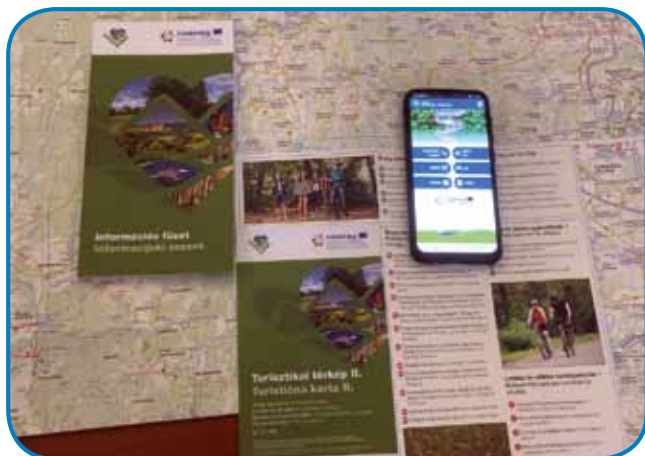
Informacijski zvezek, turistični karti in mobilna aplikacija - najbolj oprijemljivi izdelki projekta Guide2Visit

Sodelujoči želijo obiskovalcem ponuditi kompleksna doživetja, da bi se nekoč