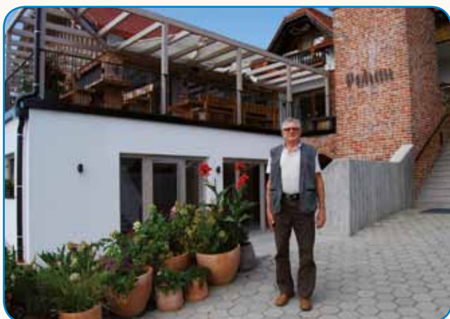
OD BOGOJINE DO ČERNElavec stran 4