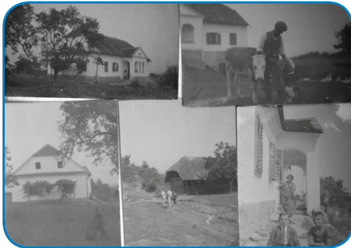
Za tiste čase so predniki (elődök) živeli v velkom, bogatom rami na Janezovom brejgi

med njimi pa Pujsar. Na srejni vrkar, ka držijo, tisto je železo na štiri prejlonce, s stero so soje tukli, kama se je maust gorazozido.«