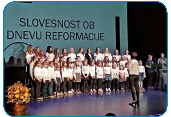
Gledalci so spremljali odlično zastavljen kulturni program. Pel je tudi otroški in mladinski pevski zbor Osnovne šole Puconci

se je položil trden grunt, ki nam omogoča življenje in razvoj za danes in za jutri v naši lepi deželi, kjer ponosni na naše prednike živimo tudi Slovenci, ki namesto govorničarimo gučimo, pa se vendar ra-