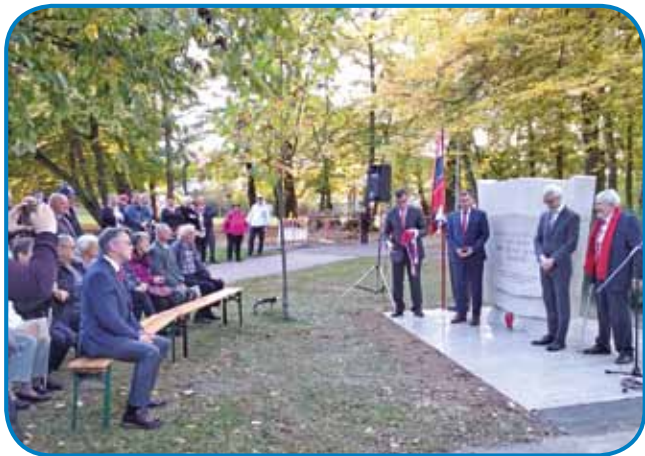
Pri odkrivanju spomenika je sodeloval tudi minister za izobraževanje, znanost in šport Jernej Pikalo (tretji z leve), ki je bil pozneje slavnostni govornik na slovesnosti, posvečeni spominskemu dnevu MO Murska Sobota