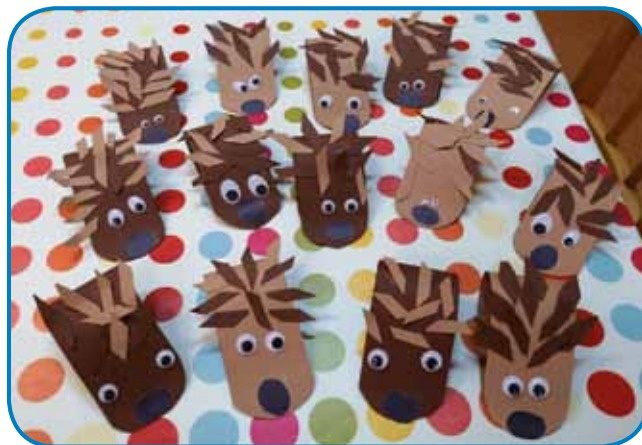
Ježke so izdelali otroci iz vrtca Sakalovci

mreč daje veliko možnosti za ustvarjanje in učenje. Letos slovensko skupino v Monošteru obiskuje 27 otrok, vrtec v Sakalovcih pa 15 otrok.