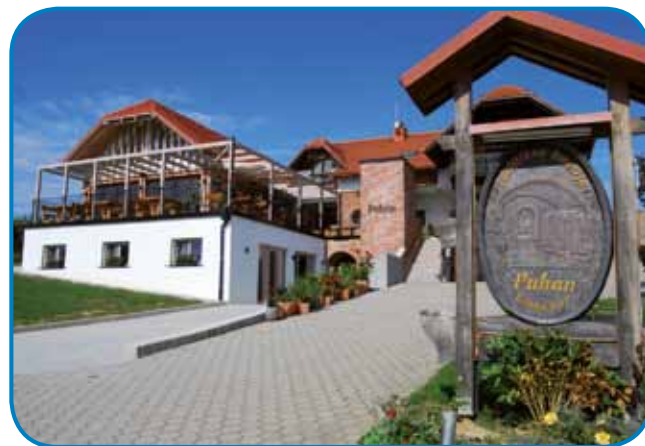
Turistična kmetija Puhan

zmlau, na steroj de leko zasado gorice in si postavo vikendico. In tak je tudi bilou. »Prva smo meli dve vinski zamenici, tisto ma zdaj moja sestra, ges pa sam te na 14 arih rejsan zasado prve gorice in gorzazido ške zidino. Po tistom sam brž ške gnauk telko zemle cuj küpo, 1996. leta pa smo ške več zemle küpili in zasadili ške več trsov, tak ka zdaj na dve hektaraj goric mam deset gezero trsov, na sterih pavamo seden različnih sort vina, največ šardoneja. Po tistom, ka smo se turizmom začnili spravlja, smo zidino ške šestkrat dali cuj zazidati. Tak je delo furt bilou, pa briga z majstri, steri so