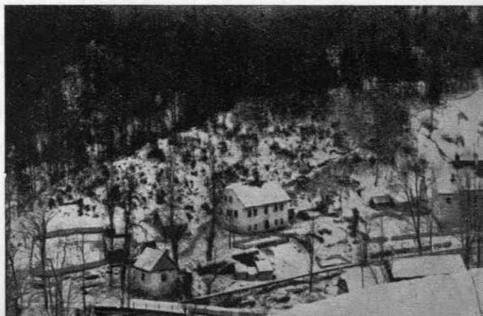
Pogled na prostor nekdanje glažute danes

V soboto pred ruško nedeljo (septembra meseca) je bilo posebno živo v tovarni ob spodnji Lobnici. Na ta dan je prišlo vsako leto mnogo romarjev od blizu in daleč k ruški cerkvi. Mnogi so porabili priložnost in obiskali tudi znano steklarno. V tovarni so za ta dan postavili in razstavili na dolgih mizah mnoge in razne izdelke domače proizvodnje na ogled in na prodaj. Obiskovalci so si radi ogledali notranjost tovarne