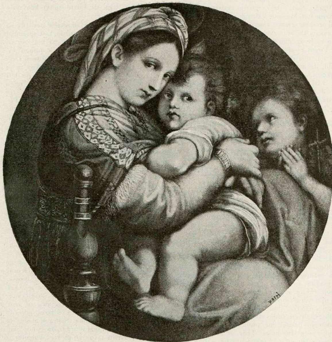
Madonna della sedia. (Naslikal Rafael.)