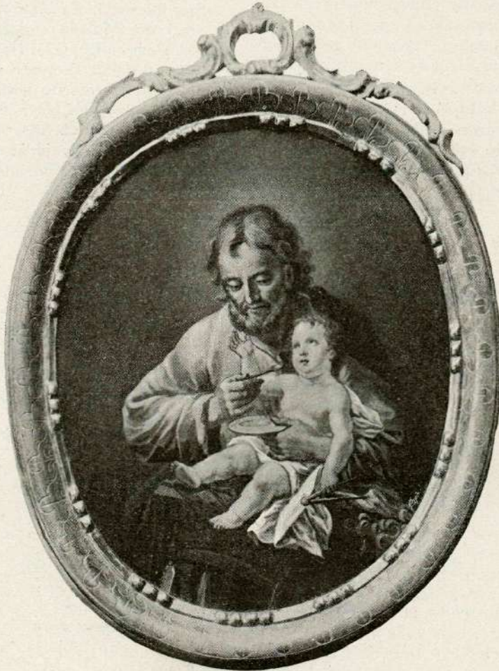
Sv. Jožef, rednik Jezusov. (Slikal Leop. Leyer.)

„Kako si se zabavala sinoči poleg nove mačehe, Ivanka?“ vpraša on.