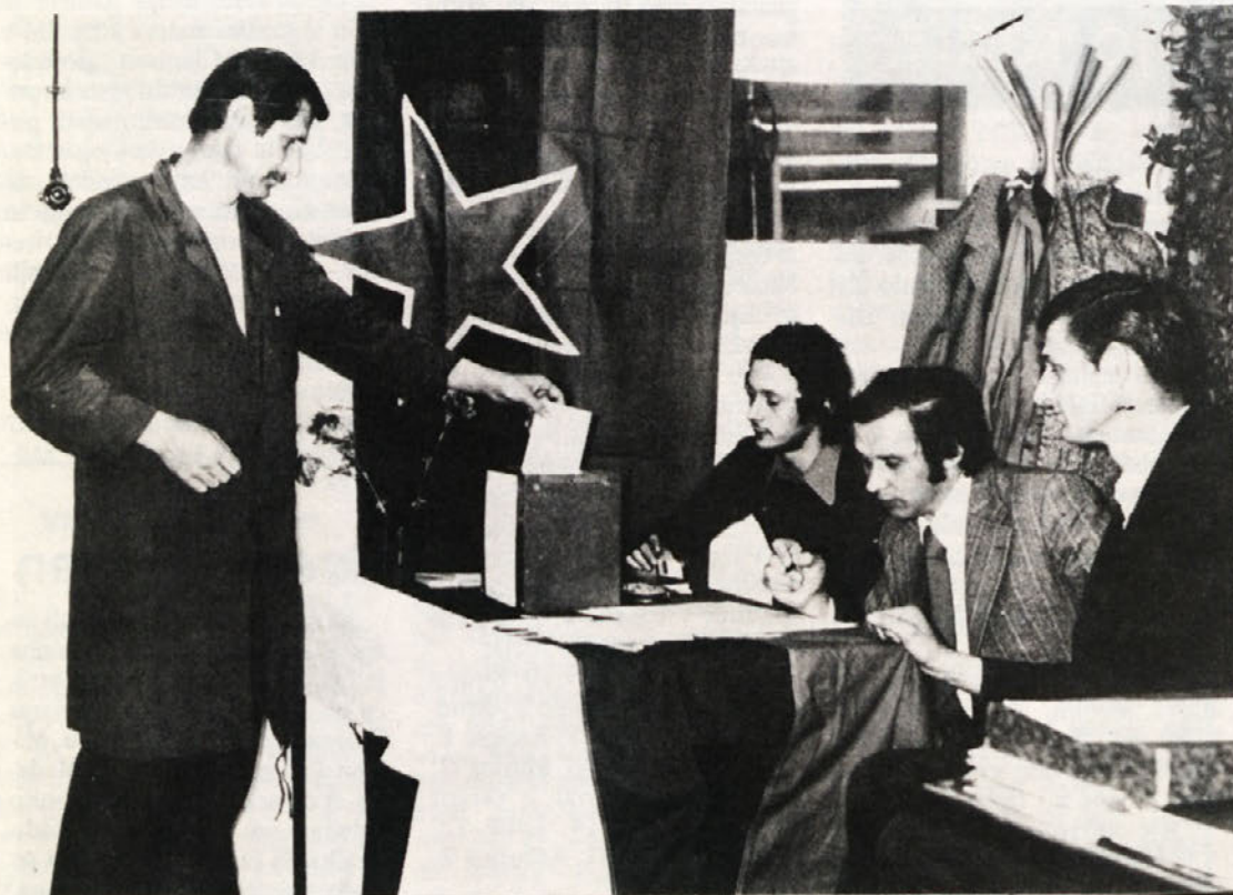
Vsa volišča v BETI so bila lepo okrašena. Volitve so potekale v slavnostnem vzdušju. Takole pa so volili v pletilnici