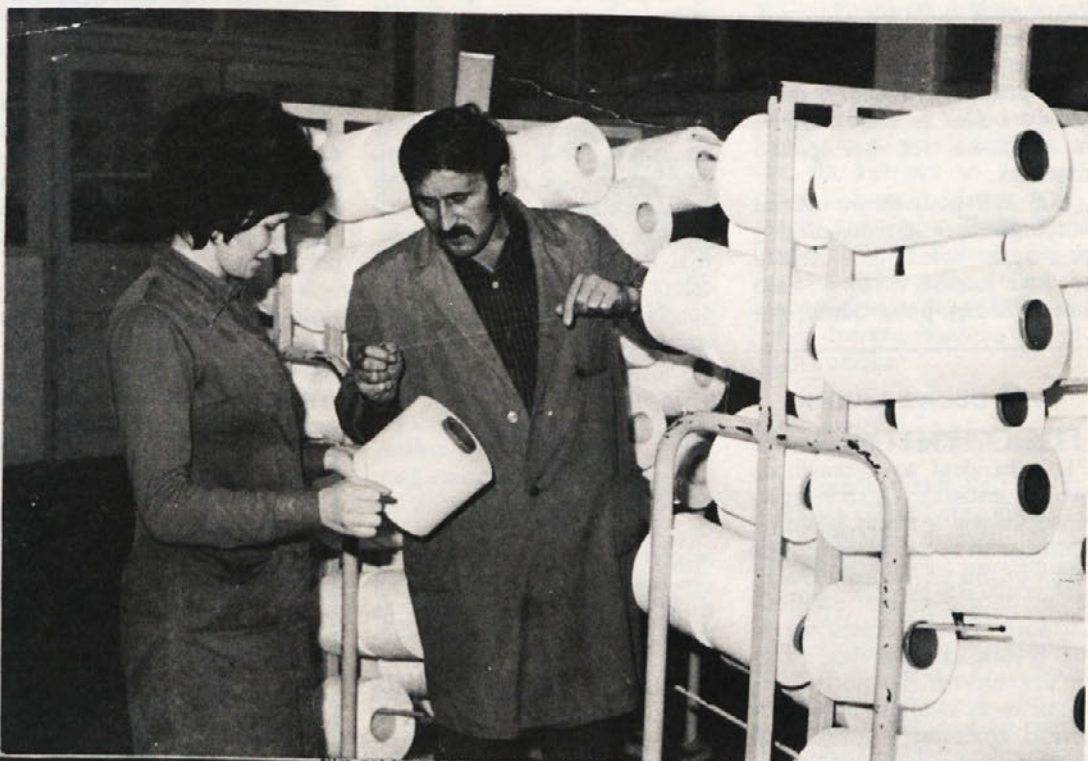
Vsakdanji delovni motiv iz TOZD Metlika

BETI sodeluje s svojimi modeli na več revijah. V začetku aprila je bilo videti modele BETI v hotelu Kvarner v Opatiji, maja prireja veliko revijo VEMA iz Maribora. BETI bo pokazala več kot 30 modelov. Tudi Karlovčani bodo lahko občudovali naše izdelke v veliki športni dvorani konec meseca maja.