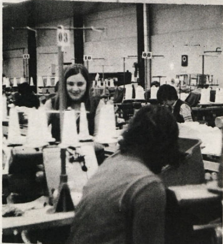
Nasmejeni obrazi med delom v TOZD Mirna peč kažejo na zadovoljstvo