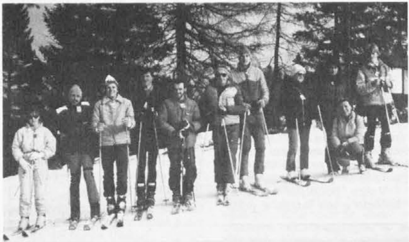
Naša liepa an vesela kompanija na počitnicah tou Cerkne

Viste le ristrettezze dei tempi, viste le numerose bocche da sfamare (se si poteva farlo sempre), quella poca terra che si possedeva veniva lavorata ad ogni costo, per necessità virtù. A tal uopo mi ricollego a questo periodo decorrente fra gli ultimi di marzo, tutto aprile e parte di maggio, per riassumere il tipico lavoro nei nostri campi.