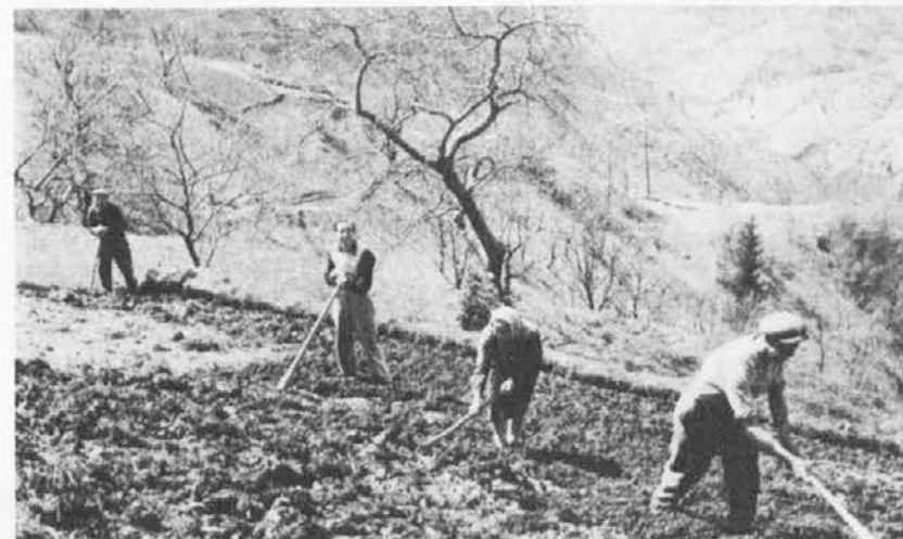
Un duro e faticoso lavoro di braccia

dei vari solchi con rudimentali battitoi costruiti da un puro e semplice manico inchiodato ad una tavola più o meno rettangolare zabutauneža . Va ricordato poi, se i suaccennati lavori terminavano entro il periodo menzionato, non s'era perciò concluso qui l'oneroso impegno. Anzi, per giungere alla proverbiale resa dei conti, il tanto sospirato raccolto, seguivano non poche altre operazioni non da meno necessarie basti pensare alla preparazione ed interrimento dei paletti e rami di sostegno rakle an veje dei fagioli e legumi vari. Poi il rassodamento, il