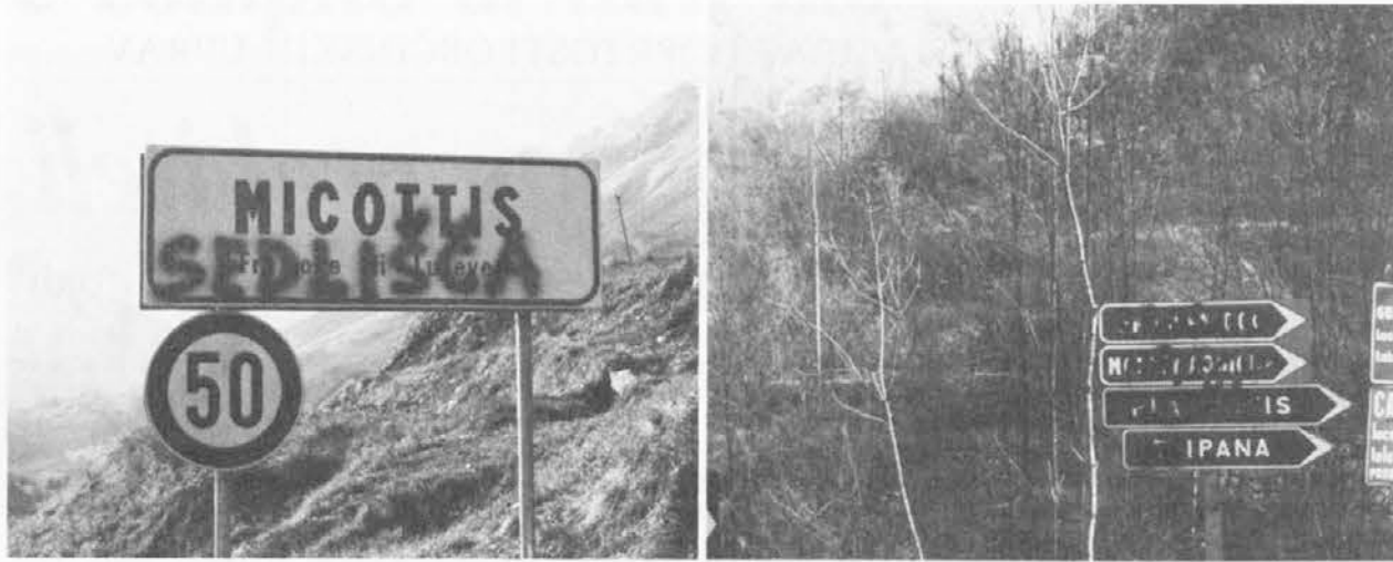
Il nome sloveno, scritto sui cartelli all'ingresso di Micottis, ben leggibile ed invece il "pasticcio" fatto a Taipana