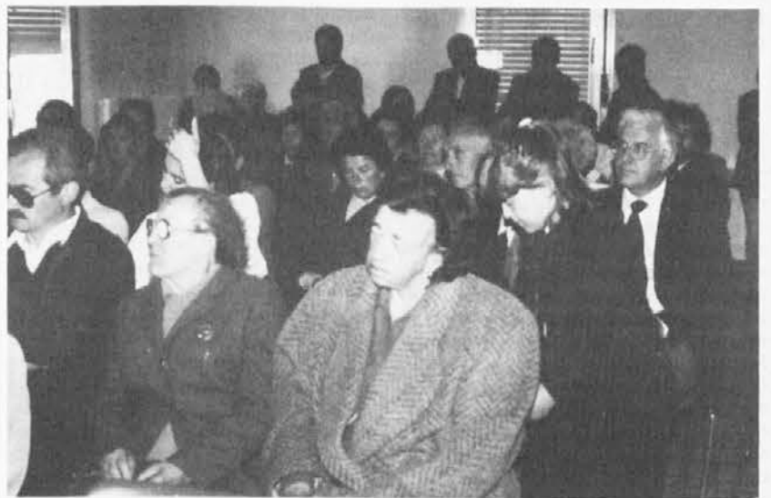
Pogled na publiko v dvorani centra Stolberg