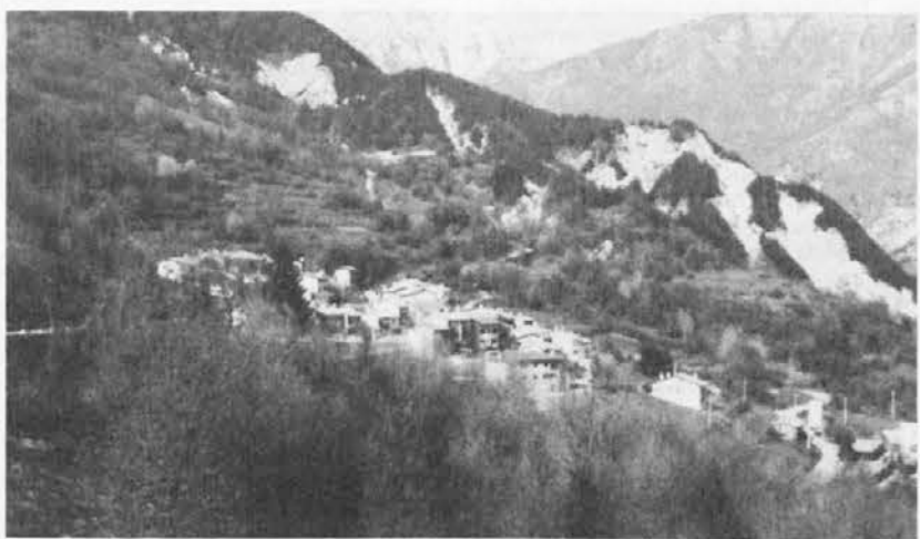
Veduta panoramica di Ciseriis nel comune di Lusevera