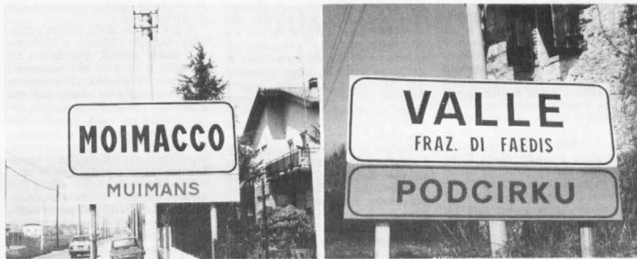
Primer dvojezičnih napisov v furlanski občini Muimans - Moimacco in v mešani občini Fojda