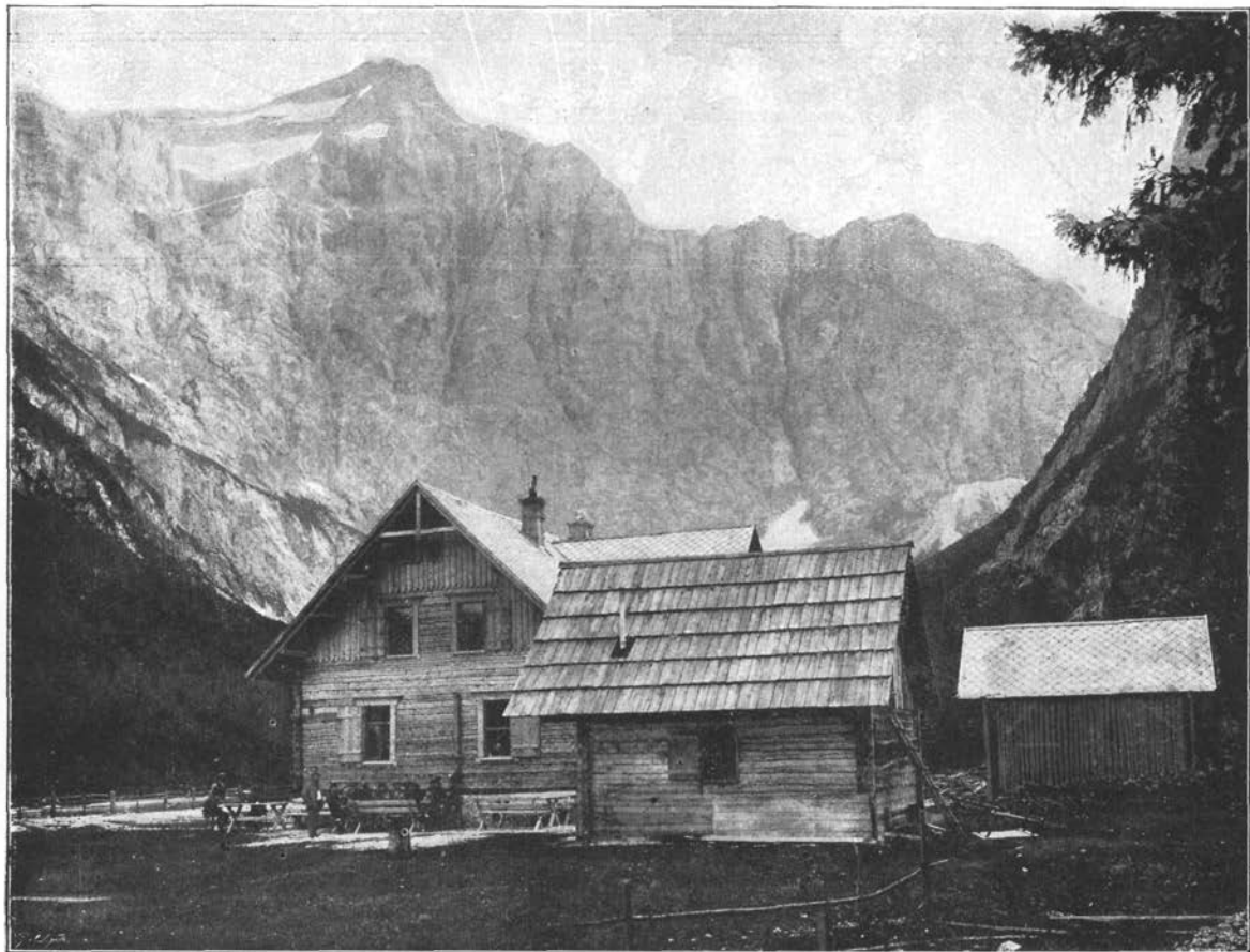
Aljažev dom in Triglavska severna stena.