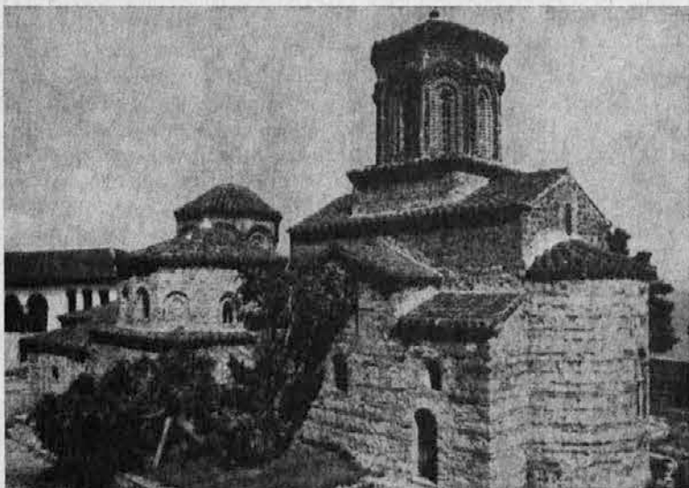
Cerkev sv. Nauma ob Ohridskem jezeru. Petsto metrov od cerkve je že jugoslovansko-albanska meja. Sv. Naum je bil eden številnih Metodovih učencev in se je zlasti proslavil z verskimi spisi v staroslovanskem jeziku

Tudi primorski Slovenci se pridružujemo praznovanju dvajsetletnice obstoja Narodnega sveta z željo, da bi bilo delo katoliško usmerjenih koroških Slovencev tudi v bodoče tako uspešno kot doslej. Kako daleč sega vpliv Narodnega sveta, pa je pokazal tudi prvi uradni obisk predstavnikov naših organizacij s Primorske pri Izvršnem svetu Slovenije, ki skuša revidirati tudi po zaslugi koroških Slovencev svoj odnos nasproti manjšinam v zamejstvu.