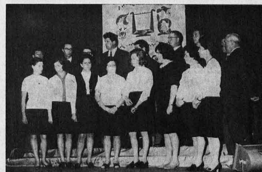
Cerkveni pevski zbor iz Mačkovelj je nastopil na lanski Reviji pevskih zborov v Rojanu in bo letos, 30. novembra, pel na enaki Reviji v Kulturnem domu v Trstu