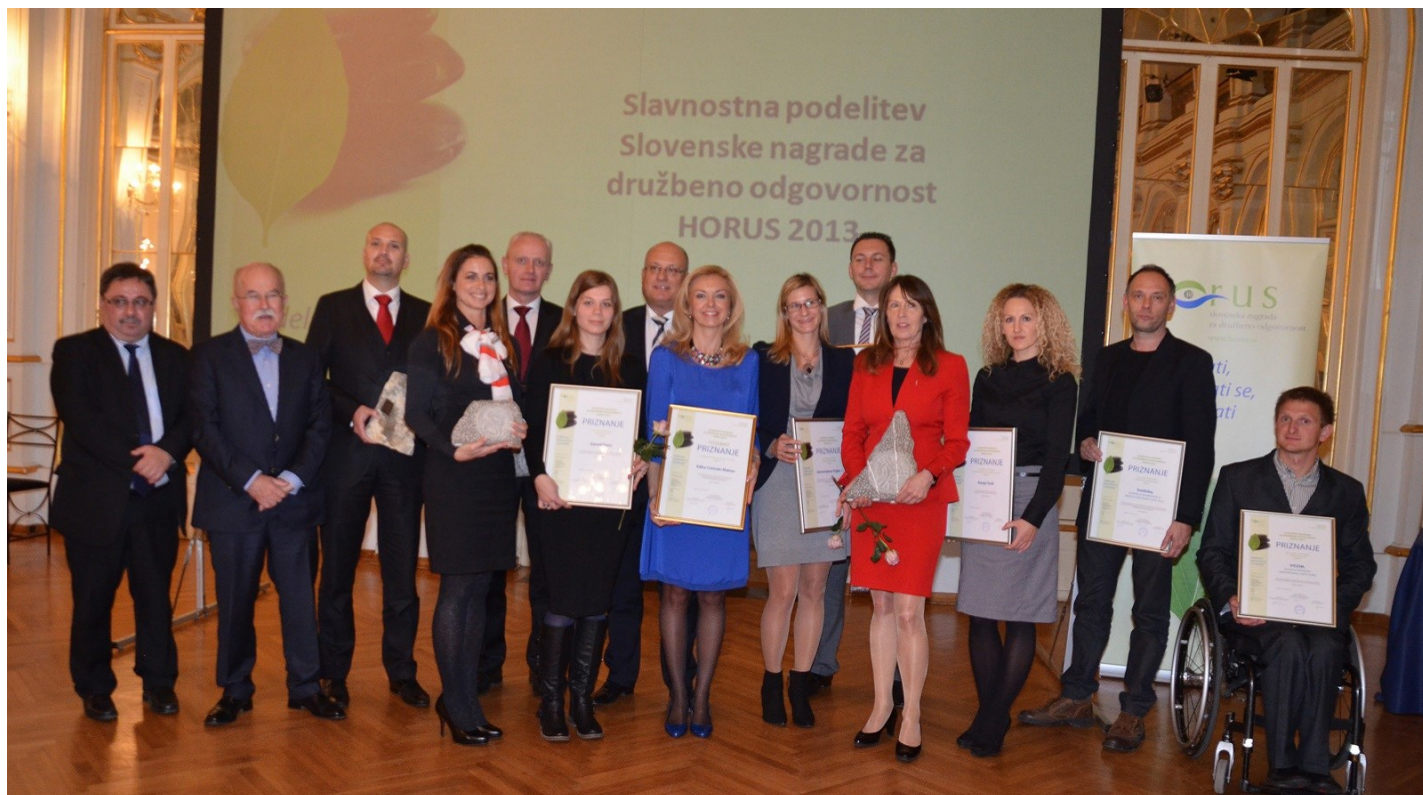
Prejemniki nagrade HORUS 2013