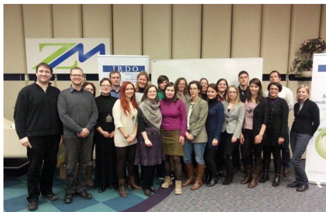
Zaključna prireditev projekta MODEL M

»Dodana vrednost programa je naš inovativen pristop, pri katerem dajemo prednost spoštovanju slehernega posameznika, njegovih znanj in sposobnosti ter težav, s katerimi se v danem trenutku sooča. V programu smo gradili predvsem na opolnomočenju posameznika, podjetniške vsebine, znanja in