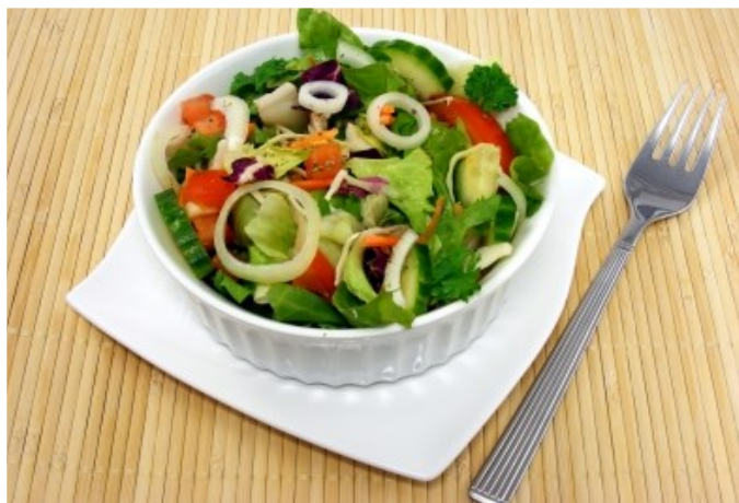
Simbolična fotografija, freedigitalphotos.net, Grant Cochrane

Pričeti moramo že v vrtcih in šolah, delati na osveščanju otrok in staršev, opozarjati prebivalstvo na zdravstvena tveganja industrijske hrane, organizirati kuharske tečaje za pripravo sezonske lokalno pridelane hrane, spodbujati vrtničkarstvo v obliki društvenega vrtnarjenja in urbane hortikulture, razvoj