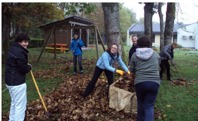
pretekle korporativne akcije

Slovenska filantropija po lanskoletnem uspešnem projektu korporativnega prostovoljstva, ko so skupaj s 33 podjetij organizirali več kot 37 korporativnih prostovoljskih akcij pri različnih prostovoljskih organizacijah, projekt nadaljuje tudi v letu 2014. K sodelovanju vabijo vse organizacije,