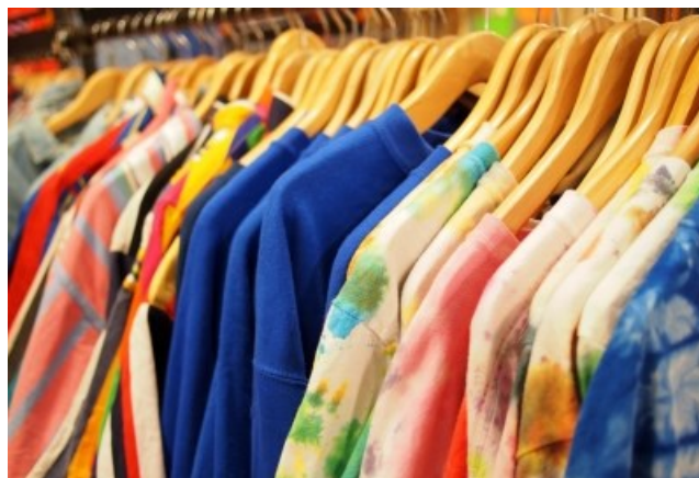
Fotografija je simbolična, www.freedigitalphotos.net , stockimages

Zveza prijateljev mladine po odlično izpeljani poskusni akciji, ko so novembra 2013 zbrali 4 tone oblačil in obutve, le-to akcijo ponavlja. Projekt, ki zasleduje cilje: humanitarnost, ekologija in ponovna uporaba, bo odslej trajnosten, saj je ZPM postal največji redni tedenski dobavitelj oblačil, obutve in šolskih potrebščin za Zvezo prijateljev mladine Slovenije za vse centre po Sloveniji.