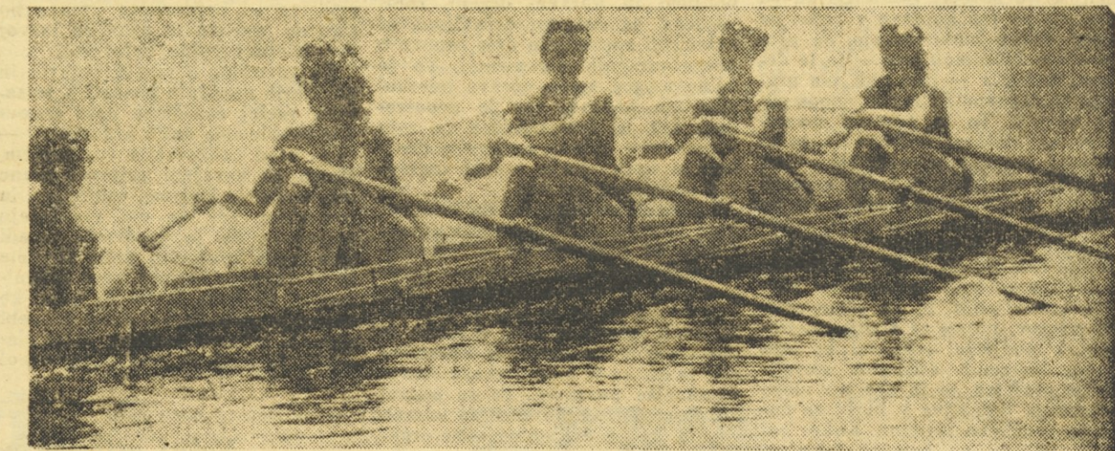
Romuški četverec s krmarjem že več dni trenira na blejskem jezeru

Katere tekmovalke pa nas bodo zastopale na letošnjem evropskem prvenstvu? Tokrat bomo nastopili s štirimi posadkami in sicer v skiffu, double-scullu, četvercu s krmarjem in osmercu. V vseh čolnih bodo nastopile mlade tekmovalke, ki še nimajo za seboj večjih mednarodnih srečanj. Vendar je posebno posadka osmerca zelo dobra. Na državnem prvenstvu sta nastopila dva osmerca in sicer Krka ter kombinirana ekipa Partizana (Subotica) in Crve-